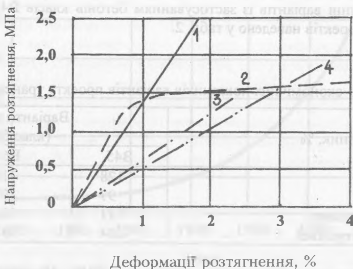
Рис. 2. Механічні характеристики неметалевої арматури: 1 – стрижні на основі вуглеволокна; 2 – стрижні на основі вуглеволокна з попередньою витяжкою до \sigma = 1,67 ГПа; 3 – стрижні на основі арамиду; 4 – стрижні на основі скловолокна

армуючий матеріал за міцністю та деформативністю приблизно відповідає сталевій високоміцній арматурі. Конструкційно арматура з вуглеволокна застосовується у вигляді фібрового дисперсного армування, сіток, тканин та окремих стрижнів та тросів. В перспективі ефективність ВНМА буде зростати у сполученні з надвисокоміцними бетонами класів В100–В200. Конструкції, утворені на основі таких бетонів та армовані вуглеволокнистими армуючими матеріалами, за вагою будуть конкурувати зі сталевими аналогами.