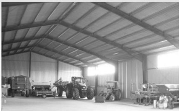
Рис. 3. Металеві каркаси модульних будівель

Цеглу і бетон замінили легкі метало-конструкції, застосування яких стало можливим завдяки новим інженерним рішенням. Результатом таких змін стало повсюдне впровадження технологій зведення споруд, в основу яких покладено модульні метало-конструкції (рис. 3).