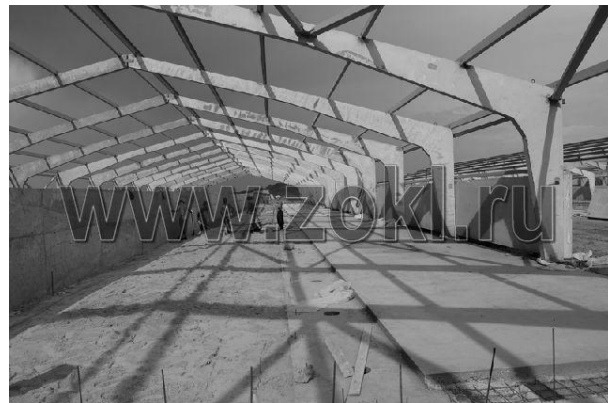
Рис. 1. Внутрішній вигляд каркасної будівлі