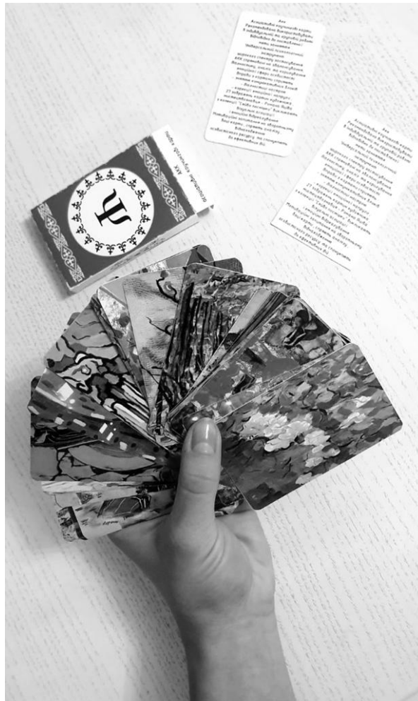
Рис. 1. Зовнішній вигляд карток «АКК» із репродукціями картин – Яціва Романа з колекції «Сяйво посмішки».

Зображення картин Яціва Романа для використання в даній колоді вибрано не випадково. Картини даної колекції насичені різноманітними кольорами, переходами; образи не мають чіткої форми, викликають миттєві візуальні асоціації та емоційні реакції. Мотиваційні запитання на зворотному боці карток сприяють аналізу, віднаходженню особистісного ресурсу та спонукають до ефективних дій. Таким чином, особливістю даної колоди асоціативних карт є зображення стимульного контенту на обох сторонах карток. На нашу думку, «АКК» мають широкий спектр застосування: їх можливості як психологічного інструменту не обмежується лише діагностично-терапевтичною функцією, оскільки вони виступають засобом