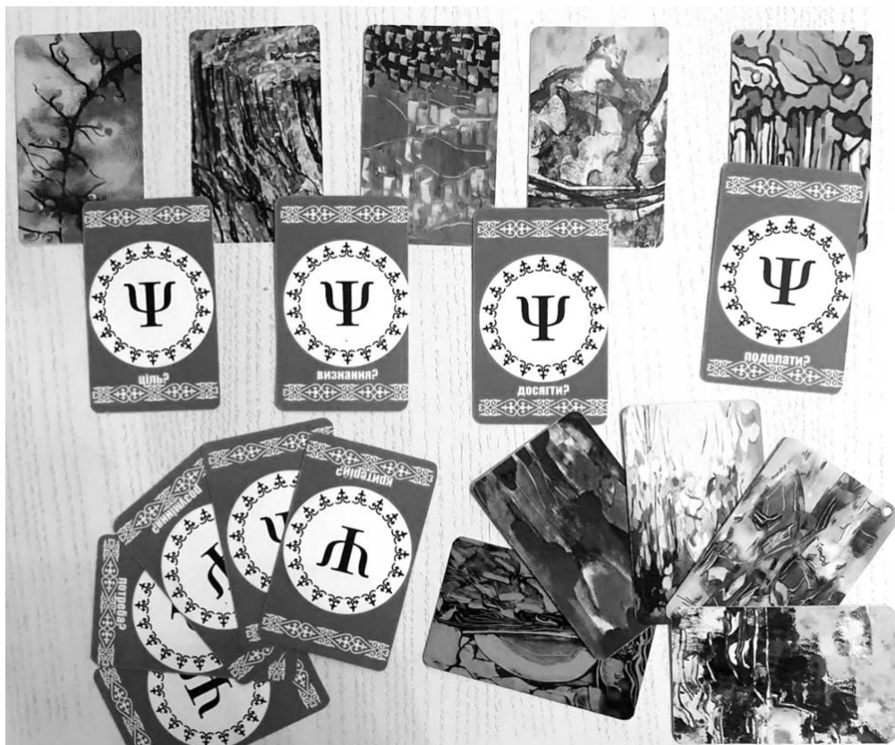
Рис. 3. Ілюстрація к варіанту використання «АКК» техніці «Мій шлях».

Даний варіант техніки можна ускладнювати, додаючи картки із зображенням картин-емоцій та окремо стимульних слів. Ілюстрація к даному варіанту виконання техніки зображено на рисунку 3.