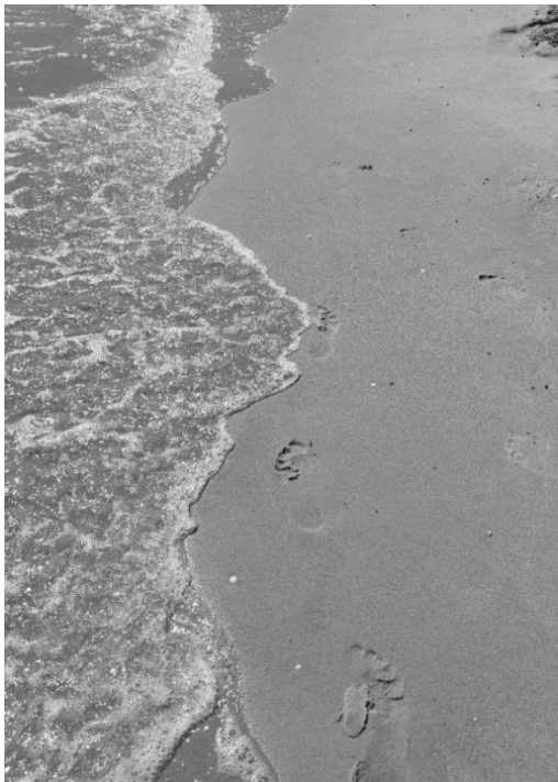
Рис. 2. Фото 1.