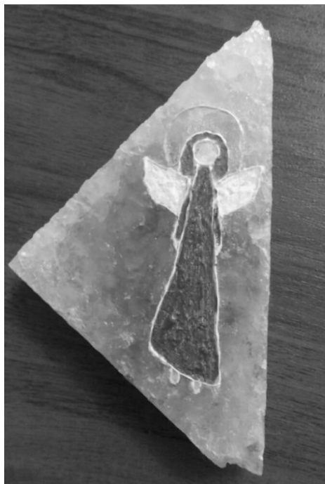
Рис. 4. Ілюстрація до методики «Робота з сіллю. Малювання янгола»

Методика корекції негативних емоційних станів «Світло в кінці тунелю». Мета роботи: корекція переживання негативних емоційних станів, корекція тривоги, пошук ресурсу в переживанні негативних емоцій.