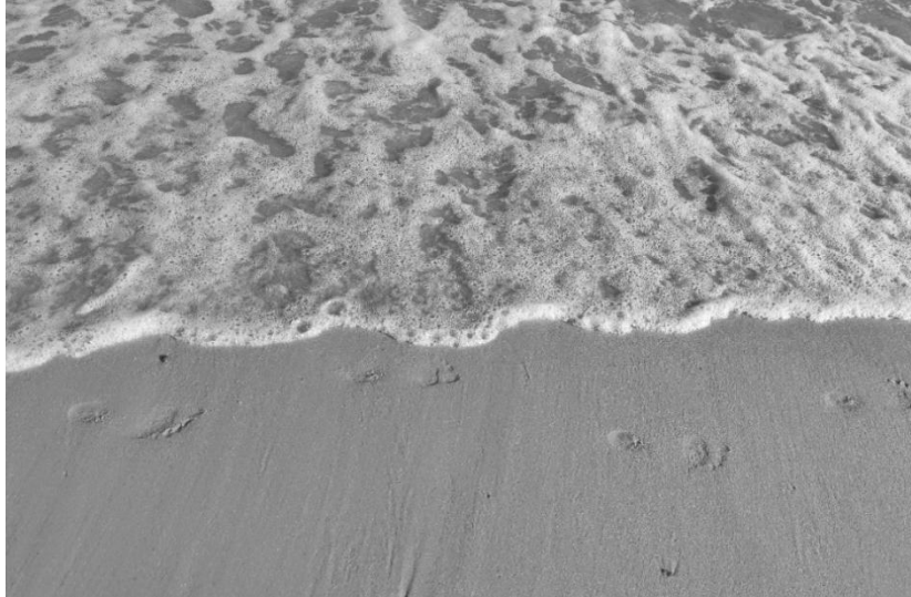
Рис. 1. Ілюстрація до методики «Сліди на піску»

Методика роботи з відчуттям тривоги «Край води». Мета роботи: робота з переживанням сприйняття різних станів одного й того ж об'єкта, переживання ситуації при неконтрольованій зміні зовнішніх умов, робота з тривожними станами.