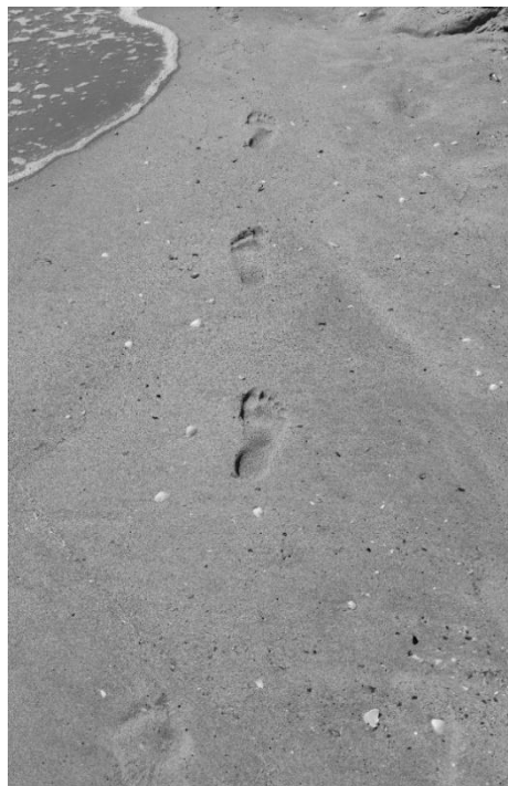
Рис. 3. Фото 2.