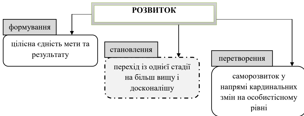
Рис.1. Педагогічна проекція структурованості феномена «розвиток»

Феномен професійно-педагогічне становлення є досить значущим для педагогічної науки, оскільки є складовим компонентом розвитку (див. рис. 1).