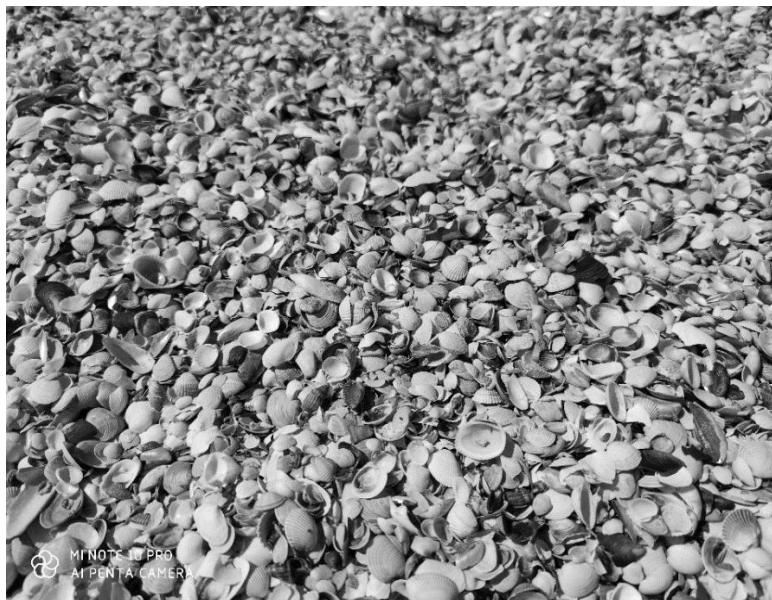
Рис. 1. Мушлі

Інструменти та матеріали: мушлі різної форми та розмірів, гуаш чи акрилові фарби, пензлики.