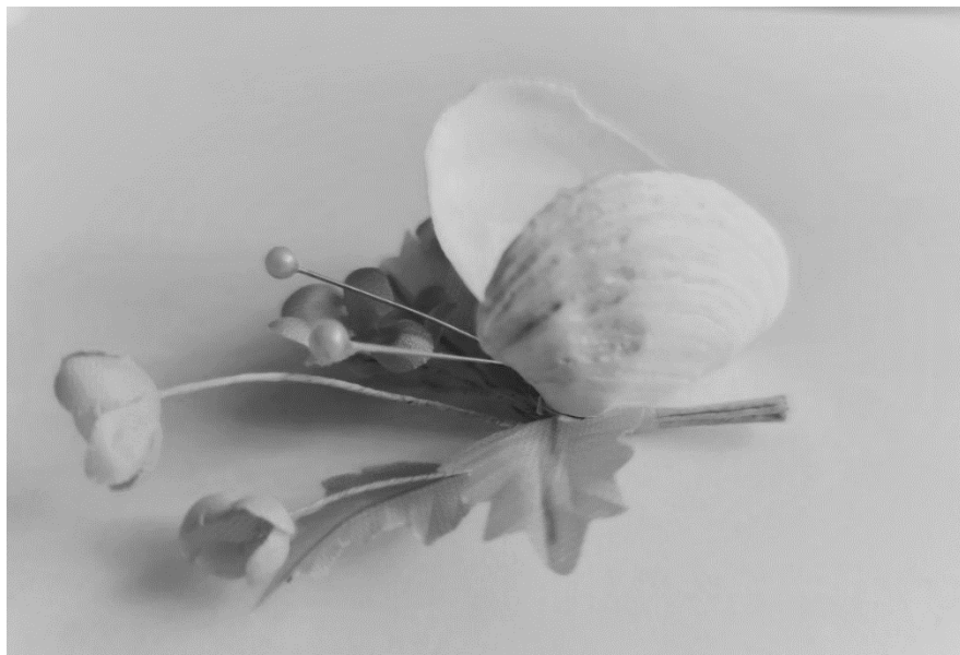
Рис. 2. Ілюстрація до методики «Робота з мушлями – метелик»

- Що відчуваєте після закінчення роботи?