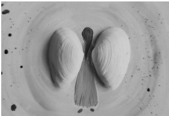
Рис. 4. Ілюстрація до методики «Янголи»

Методика «Замки із піску». Робота із переживаннями стосовно здійснення мрій, переживаннями фрустрації нездійсненності мрії. В основі техніки лежить переживання метафори зведення піщаних замків.