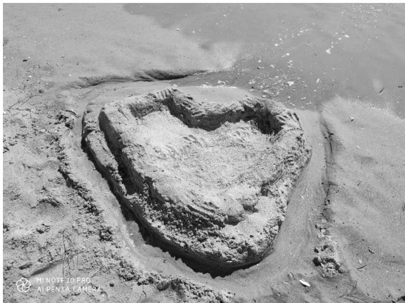
Рис. 5. Ілюстрація до методики «Замки із піску»

Через деякий час, можливо на наступний день чи після припливу погляньте, як змінився Ваш піщаний замок. Чи зруйнувався він повністю, частково, чи його зовсім не зачепило водою?