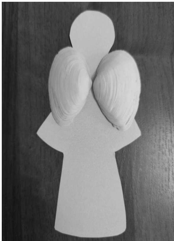
Рис. 3. Ілюстрація до методики «Крила янгола»