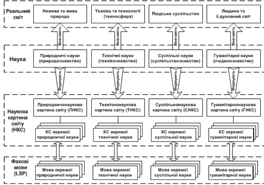
Рисунок 2. Наукова картина світу та її мовна фіксація

Інструментом формування, фіксування, зберігання та передавання наукових знань про світ є фахові мови, тобто мови кожної з наукових дисциплін (рис. 2). На відміну від БКС (рис. 1), яка має чітку національну специфіку, НКС універсальна (єдина) для всіх мовних спільнот, бо наукові знання об'єктивні, вони не залежать від специфіки мови того чи іншого народу, його менталітету, традицій, моральних пріоритетів, національної культури загалом. Проте, маючи єдиний для всіх народів змістовий інваріант, НКС набуває національні форми вираження завдяки формуванню національних фахових мов (рис. 1). Національномовне оформлення НКС не стосується її змісту, а лише адаптує універсальне знання до потреб конкретної мовної спільноти. Безумовно, НКС існує у «національній мовній оболонці» лише тих народів, які мають традицію добувати нові наукові знання та оперувати ними, тобто там, де є відповідна наукова традиція [21, с. 12-13]. Отже, маємо взаємоузгоджене формування НКС та її «мовної оболонки» – системи фахових мов (рис. 1).