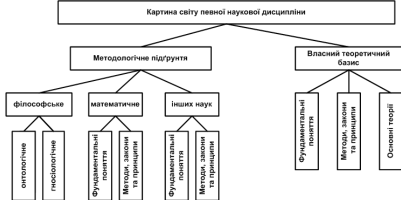
Рисунок 3. Картина світу окремої наукової дисципліни