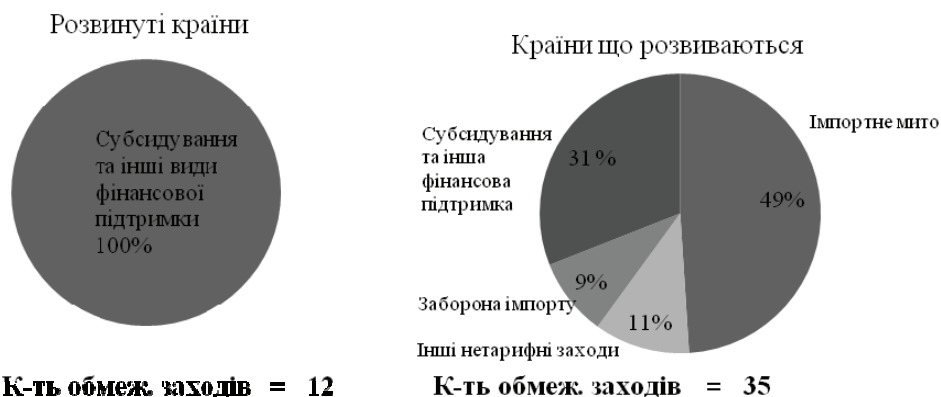
Рис. 2. Збільшення кількості заходів торговельного протекціонізму за групами країн (2008-2009 рр., без урахування антидемпінгових заходів)