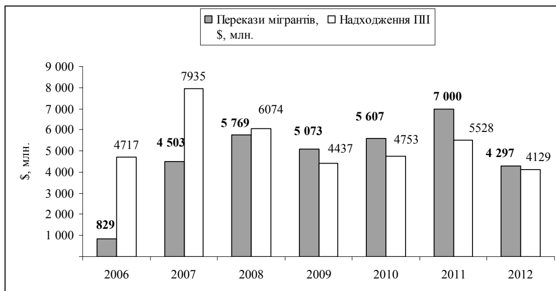
Рис. 2. Перекази мігрантів та надходження ПІІ в Україну в 2006-2012 рр.

Спрямуються перекази міжнародних трудових мігрантів на поточні витрати: покращення житлово-побутових і комфортних умов щоденного життя, здобуття освіти дітей та отримання товарів і послуг першої необхідності [9]. Таке спрямування коштів здійснює певний позитивний вплив на інвестиційний розвиток регіонів та країни, хоча перекази міжнародних трудових мігрантів і не можуть бути розцінені як прямі іноземні інвестиції. Адже з рахунок переказів трудових мігрантів відбувається стимулювання внутрішнього ринку, що позитивно впливає і на виробництво. Додатково потрібно зазначити позитивну роль таких коштів у розвитку людського капіталу (адже значна їх частка спрямовується на отримання освіти). Порівнюючи суму переказів трудових мігрантів і надходження ПІІ, можемо зробити висновок що обидва потоки іноземної валюти в Україну приблизно на однаковому рівні (рис. 2).