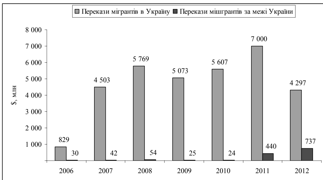
Рис. 1. Грошові перекази трудових мігрантів до України і за її межі

Джерело: побудовано автором згідно [1, 2]