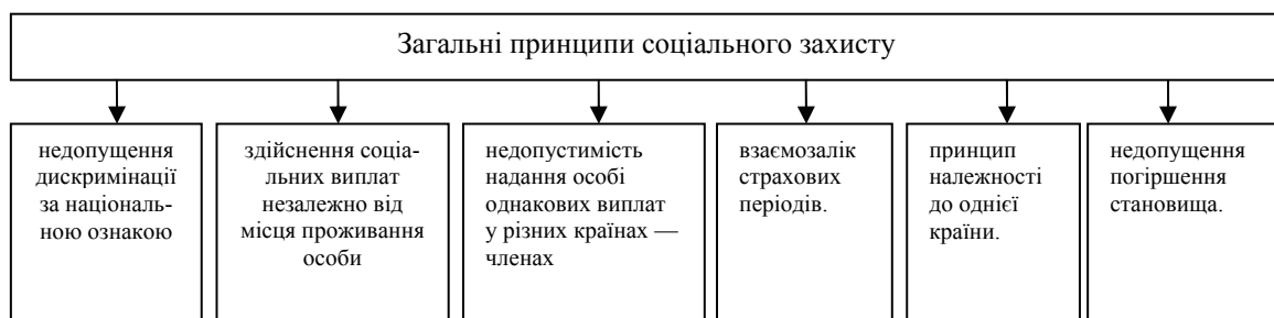
Рис. 3. Загальні принципи соціального захисту в ЄС

Існують певні принципи, на яких ґрунтується законодавство ЄС щодо соціального захисту (рис.3).