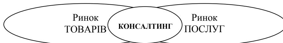
Рис. 1 Місце консалтингу в системі ринків

За умов перенасичення інформацією всіх сфер господарства виникає потреба у постійному, динамічному обміні інформацією на різних рівнях, тобто потреба в інформаційних консультаціях, консультативному обґрунтуванні стратегії, операційного менеджменту, ІТ-консалтингу, бізнес консультаційних послуг, зв'язку із засобами масової інформації, енергетики, фінансових послуг, охорони здоров'я, виробництва, державного сектора, роздрібно торгівлі, комунальних послуг.