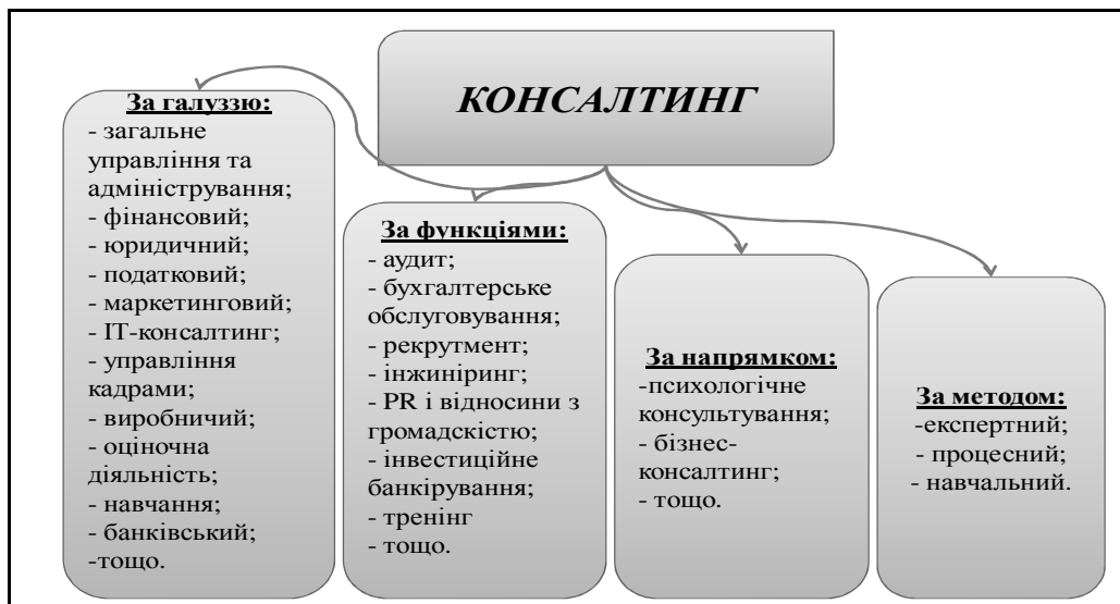
Рис. 1. Типізація консалтингу

Найбільшого розгляду заслуговує типізація консалтингу у відповідності до методу застосування. У міжнародній практиці прийнято виділяти три види консультаційних послуг: процесний або проектний, експертний і навчальний (таблиця 4).