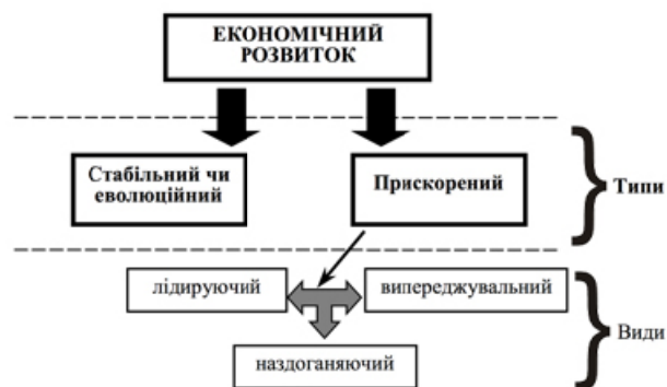
Рис. 1. Класифікація типів та видів економічного розвитку

Важливими елементами стабільного, чи еволюційного типу розвитку є послідовність та спадковість змін. Існує чітка черговість проходження етапів, а також існує певна спадковість у відборі адекватних існуючим умовам змін у продуктивних силах та формах господарювання.