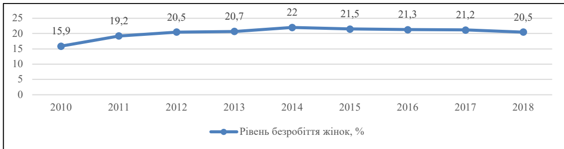
Рис. 2 Рівень безробіття жінок в Саудівській Аравії 2010-2018 роки, %

Примітка: складено авторами за даними Світового банку [13].