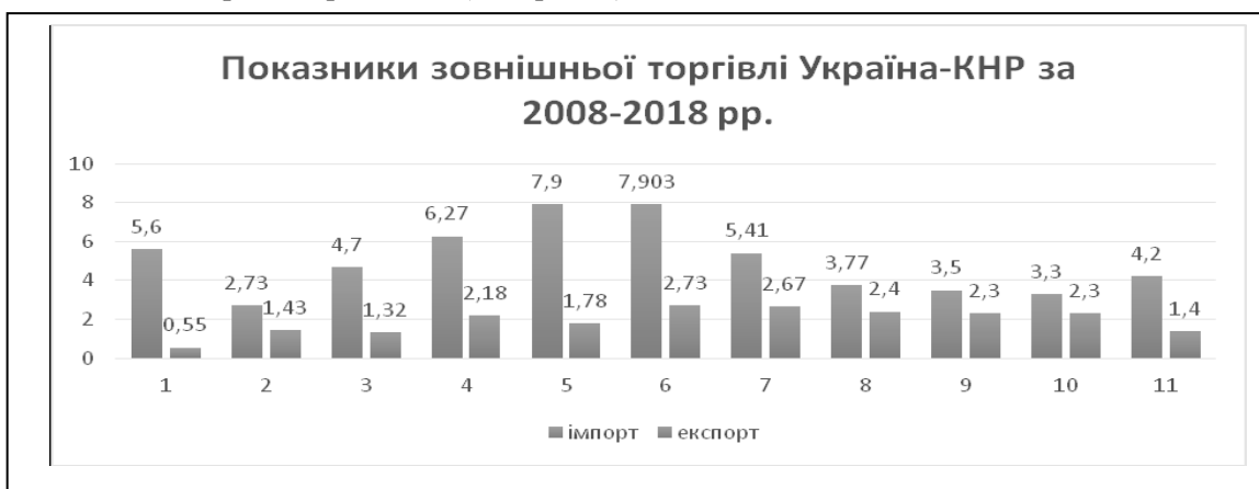
Рис. 1 Показники зовнішньої торгівлі Україна-КНР за 2008-2018 рр.

Китай зайняв перше місце за обсягом зовнішньої торгівлі, перше місце – за експортом товарів, друге – за імпортом товарів, третє – за експортом і друге – за імпортом послуг. Щодо торговельних взаємовідносин України і Китаю, слід відзначити, що спостерігається суттєвий дисбаланс між обсягами експортних й імпорتنних поставок. Протягом 2011-2016 рр. експорт українських товарів і послуг до Китаю перебував у межах 1,9-2,8 млрд доларів США, тоді як відповідні обсяги імпорту сягали 8 млрд доларів США. Максимальне значення коефіцієнту покриття імпорту експортом становило лише 0,63 у 2015 р., мінімальне – досить незначне – 0,23 у 2012 р. Негативне сальдо в торгівлі України з Китаєм у 2012 р. склало 6,1 млрд доларів США, у 2016 році його значення зменшилось до 2,9 млрд доларів США (див. рис. 1):