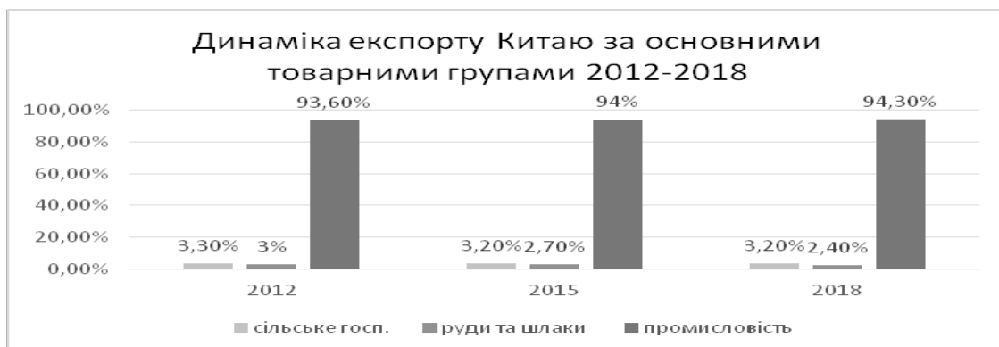
Рис. 2 Динаміка експорту Китаю за основними товарними групами 2012-2018 рр.

Водночас відбувається зменшення частки технологічно складної продукції машинобудування, яка у 2015 р. становила лише 3,7%. Попит економіки України на продукцію китайських виробників є більш диверсифікованим, значну частку у його структурі займають високо і середньо технологічні товари (машини, обладнання та механізми; електротехнічне обладнання; продукція хімічної та пов'язаних з нею галузей промисловості). Частка торгівлі послугами відіграє незначну роль у його зовнішньоторговельній діяльності, при цьому чітко прослідковується тенденція щодо збереження показників експорту послуг та збільшення їхнього імпорту (сальдо торгівлі послугами є від'ємним та має тенденцію до подальшого зниження). Якщо розглянути динаміку товарної структури зовнішньої торгівлі Китаю, то можна відзначити декілька ключових особливостей (див. рис. 2):