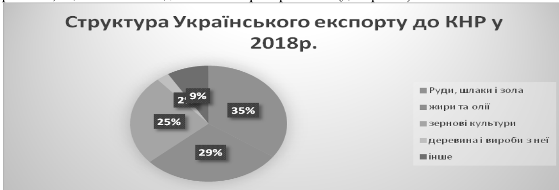
Рис. 4 Структура українського експорту до КНР у 2018 р. Примітка: складено автором за матеріалами [15]

основних експортних позицій Китаю відсутні енергоносії, незважаючи на високі природні запаси корисних копалин у Китаї, що пояснюється швидкими темпами зростання китайського виробництва, яке, крім того, оцінюється як недостатньо енергоефективне (див. рис. 4):