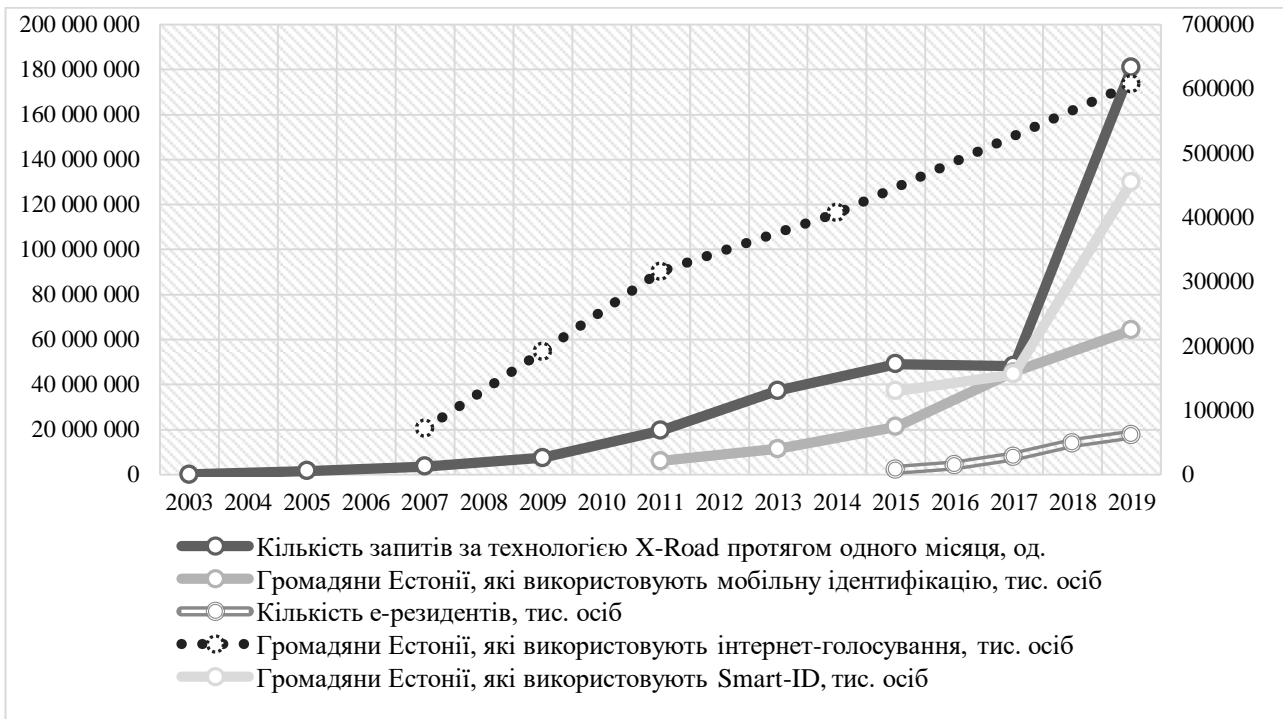
Рис. 3. Динаміка цифрової активності Естонії.

з метою перетворення країни на найбільш сприятливе у світі місце для інноваторів. В межах даного проекту держава здійснює проведення хакатонів, забезпечує надання інформаційних послуг, залучає інвестиційні ресурси, виконує регулюючу функцію шляхом взаємодії з органами державної влади. Станом на кінець 2019 року в Естонії налічується 650 стартапів, оборот яких за перше півріччя 2019 року склав 155 млн євро, від яких надійшло податків до державного бюджету в обсязі 32,7 млн євро та які забезпечили зайнятість 4 848 осіб [10].