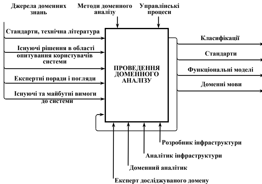
Рис. 1. Модель доменного аналізу

Зв'язані домени включають, але не обмежуються доменом «Програмна інженерія», існуючими рекомендаціями знань області (SWEBOOK, Guidelines for Software Engineering Education), існуючою системою освіти і її особливостями, законодавством.