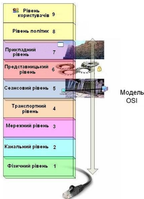
Рис. 2. Розширена модель OSI

Пропонується доповнити модель двома рівнями — користувачів та політик та перетворення моделі у дев'ятирівневу.