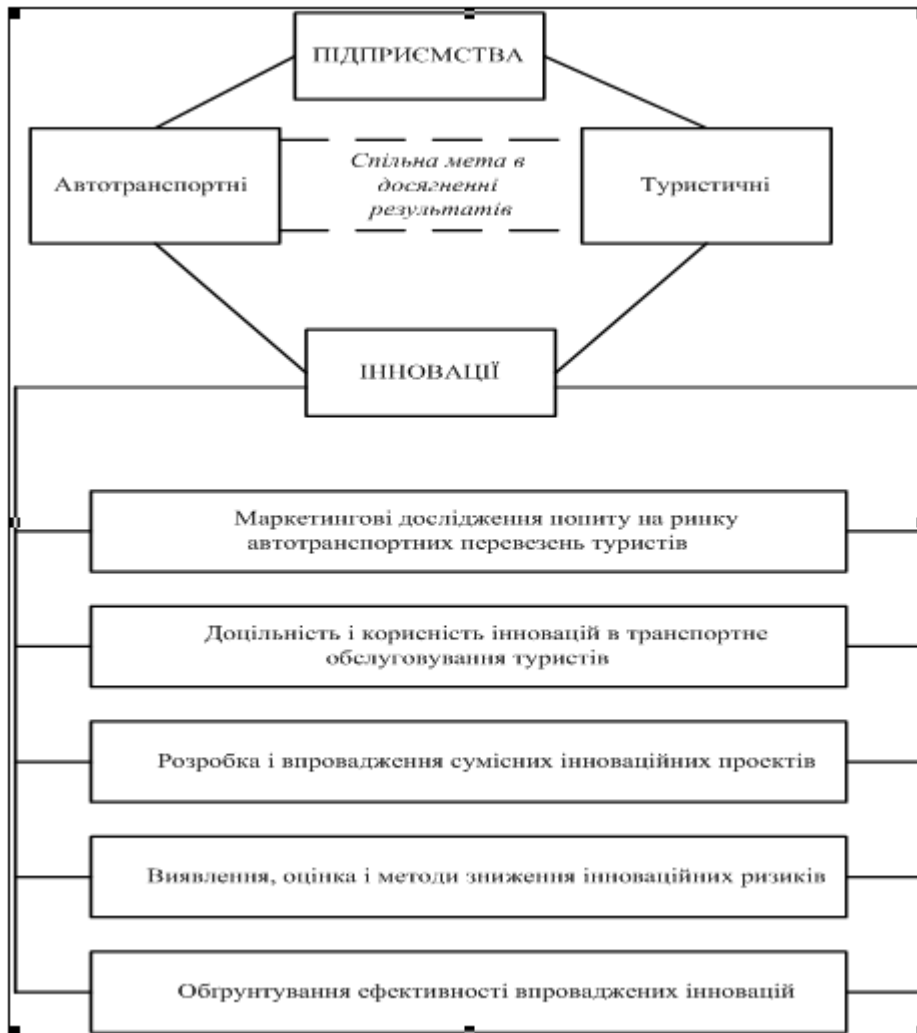
Рис. 2 . Взаємодія автотранспортних і туристичних підприємств в процесі впровадження інновацій

Висновки. Подальший розвиток інноваційних технологій потребує проведення більш глибоких теоретичних досліджень існуючого національного і закордонного досвіду, вдосконалення методологічних підходів до розробки концепції інноваційного розвитку підприємств автомобільного транспорту по обслуговуванню туристів.