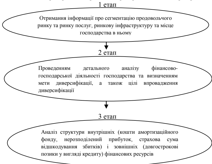
Рис. 1 Етапи при прийнятті рішення про проведення диверсифікації.

Підприємство, яке вирішило запровадити в процес виробництва диверсифікацію, повинно врахувати всі фактори, що впливають на її впровадження та пройти основні етапи диверсифікації. На рис. 1 представлені етапи при прийнятті рішення про проведення диверсифікації.