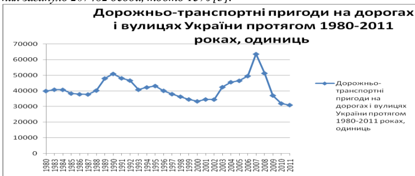
Рис. 1. Кількість дорожньо – транспортних пригод в Україні протягом 1980 – 2011 років [5]

Зазначимо, що розвиток автотранспортного страхування в цілому, в тому числі його складової обов'язкового страхування цивільно - правової відповідальності власників автотранспортних засобів, є запорукою посилення безпеки населення та мінімізації негативних наслідків дорожньо - транспортних пригод. Так станом на 2011 рік на дорогах і вулицях України сталося 30927 пригод в яких були постраждалі. Як видно з рис. 1 найбільше дорожньо-транспортних пригод сталося в 1990 році – 50908 (набуття країною незалежності та формуванням власної економічної системи) та у 2008 році – 512279 (світова фінансово – економічна криза). Отже, за останні 30 років сталося 1245234 пригоди у яких потерпіло 1586842 осіб, з них загинуло 207482 особи, тобто 13% [5].