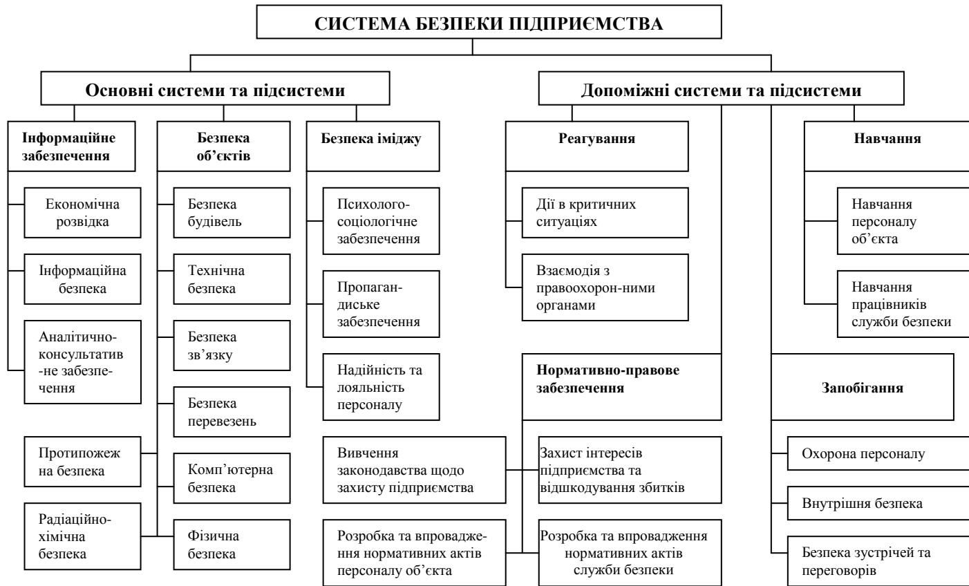
Рис. 2. Система безпеки підприємства [розроблено автором]