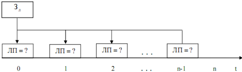
Рис.2 Схема формування лізингових платежів у разі їх здійснення на початку періоду

Таким чином, лізингова схема матиме наступний вигляд (рис.2):