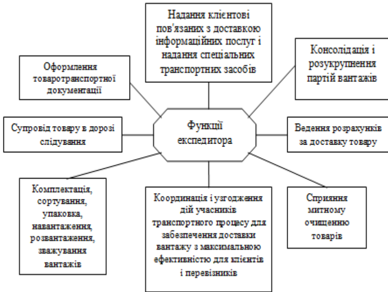
Рис. 1 Функції експедиторів

експедиційної діяльності. Функції експедитора не змінюються, тоді як види послуг схильні до динамічної зміни під впливом кон'юнктури транспортного ринку, соціальних, економічних, політичних і інших чинників зовнішньої середовища.