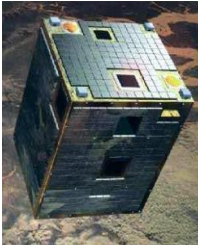
Рис. 5. Бельгийский мини КА D33 PROBA

новых гиromетров, акселерометров и вычислительных комплексов.