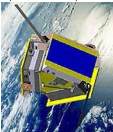
Рис. 4. Нано-спутник SNAP-1

Спутник QuakeSat был изготовлен в лаборатории разработки космических систем Стэнфордского университета (США) под руководством профессора Роберта Твиггса ( Robert Twiggs ). КА имеет массу 3 кг и был запущен в 2003 году. Он предназначен для выполнения научных исследований по обнаружению признаков землетрясений.