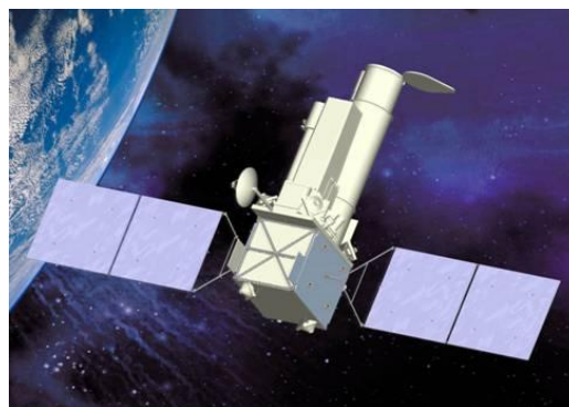
Рис. 1. Космический аппарат СПЕКТР-РГ на базе УКП «Ямал»

Среди зарубежных разработок стоит отметить весомый вклад в развитие и эксплуатацию УКП России. Так, в РРК «Энергия» им. С.П. Королева создана УКП «Ямал» (рис. 1). Она прошла летную апробацию в составе спутника связи «Ямал» в 1999г. В ГКНПЦ им. М.В. Хруничева разработана УКП «Яхта». На ее основе были созданы МКА связи, дистанционного зондирования Земли и научных исследований на орбите различной высоты и ориентации. В НПО машиностроения разработана платформа похожая и близкая к платформе «Яхта». Так же этими вопросами занимаются в НПО ПМ им. М.Ф. Решетнева, КБ «Полет», НПП ВНИИЭМ [6].