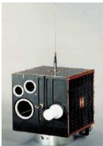
Рис. 3. Микроспутник DRL-Tubsat

Спутник QuakeSat был изготовлен в лаборатории разработки космических систем Стэнфордского университета (США) под руководством профессора Роберта Твиггса ( Robert Twiggs ). КА имеет массу 3 кг и был запущен в 2003 году. Он предназначен для выполнения научных исследований по обнаружению признаков землетрясений.