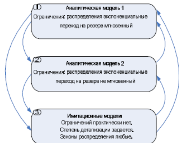
Рис.2 Архитектура среды итеративного моделирования

Нижний уровень – имитационные модели, решают задачи количественного анализа с любой степенью детализации процессов передачи ММТ.