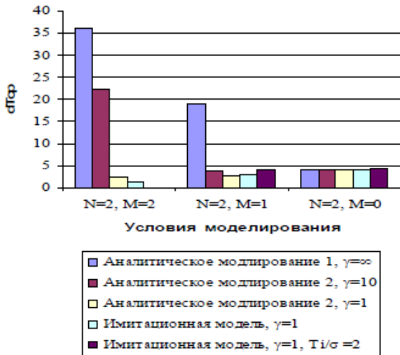
Рис.3 Сравнительная оценка точности анализа, выполняемого моделями итеративного моделирования

- заключительный с высокой степенью соответствия реальным процессам передачи ММТ (имитационные модели – высокая точность и большие затраты времени).