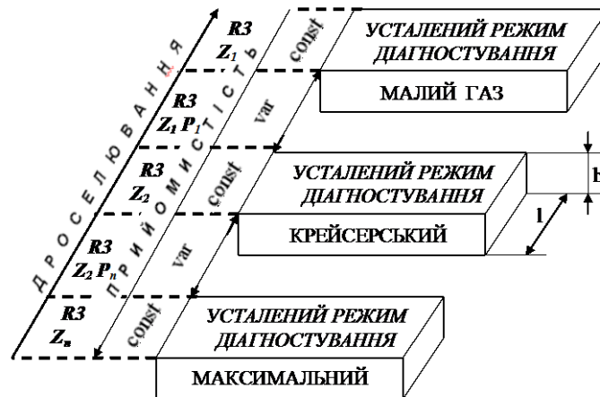
Рис. 3. Фрагмент застосування стратегії паралельної (горизонтальної) декомпозиції STRph при структурванні бази знань спеціалізованої автоматизованої системи діагностування й підтримки прийняття рішень (на прикладі моделювання перехідних робочих режимів роботи ГТД для одного з рівнів за дуальною концепцією): R_3 – третій рівень бази знань, де проектується знання щодо режимів роботи ГТД; Z_1, Z_2, Z_n – база знань для визначених усталених режимів роботи ГТД, на яких здійснюється діагностування; P_1, P_2, P_n – база знань для визначених перехідних режимів роботи ГТД, на яких здійснюється діагностування; l, h – відповідні межі коливань режимів роботи ГТД.

Дедуктивна стратегія STRtd структурування бази знань АСД ППР декларує переміщення зверху-донизу від n \Rightarrow n + 1 ,