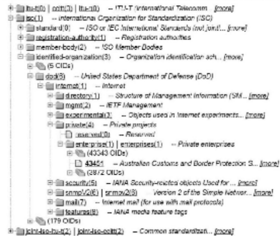
Рис. 3. Наявність ідентифікаторів об'єктів прикордонного відомства Австралії

Варто зазначити, що ідентифікатори прикордонних відомств США та Австралії входять в розділ International Organization for Standardization (ISO) , підрозділ United States Department of Defense та знаходяться у гілці приватних організацій.