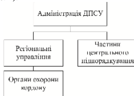
Рис. 4. Загальна структура ДПСУ

Згідно із Законом України "Про Державну прикордонну службу України" прикордонне відомство є центральним органом виконавчої влади, що реалізує державну політику у сфері охорони державного кордону. Враховуючи обґрунтовані та наведені в роботі [10] пропозиції щодо подальшої класифікації ідентифікаторів об'єктів державних органів, для органів виконавчої влади запропоновано використовувати гілку {joint-iso-itu-t(2) country(16) ua(804) gov(1) executive(4)}, в якій будемо створювати дерево ідентифікаторів об'єктів ДПСУ відповідно до структури прикордонного відомства [11] (рис. 4).