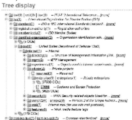
Рис. 2. Наявність ідентифікаторів об'єктів прикордонного відомства США

З метою формування українського сегменту світового простору ідентифікаторів об'єктів спробуємо описати ієрархічну гілку ДПСУ. Аналіз репозиторію ідентифікаторів об'єктів щодо наявності в ньому ідентифікаторів прикордонних відомств інших держав показав, що тільки США та Австралія представлені в ньому (рис. 2-3).