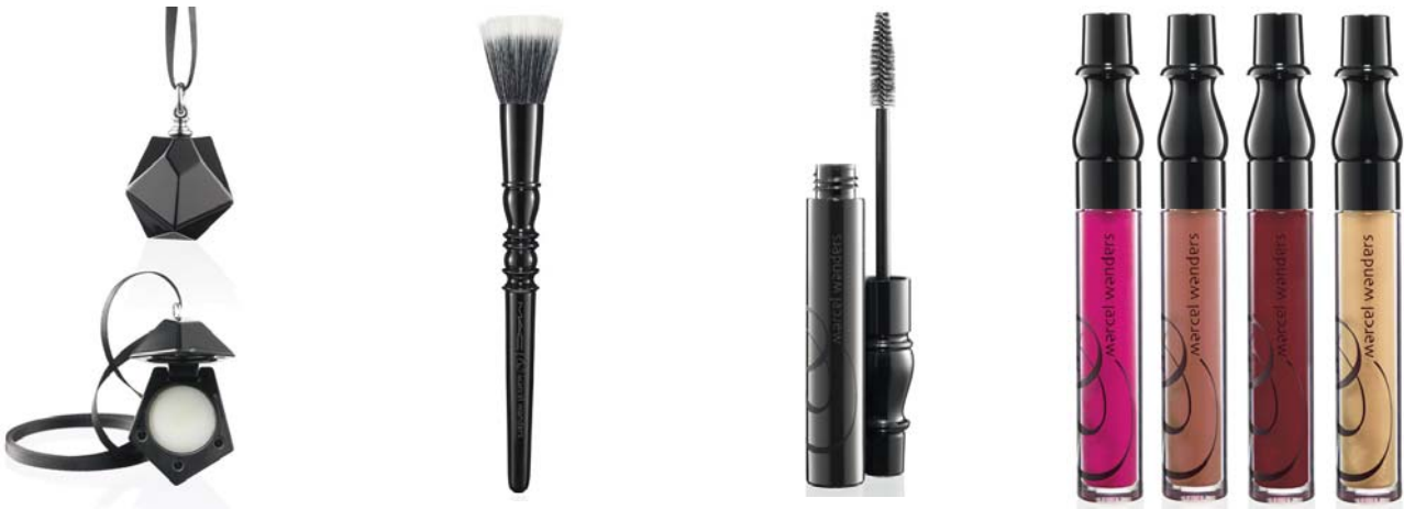
Рис. 5. Колекція косметики класу люкс

Також представлено новий проект – колекцію посуду для першого класу королівських голандських авіаліній KLM. Набір предметів для сніданків, обідів і вечерь включає в себе порцеляновий посуд, скляні келихи, столові прилади, полотняні серветки і підноси (рис. 6).