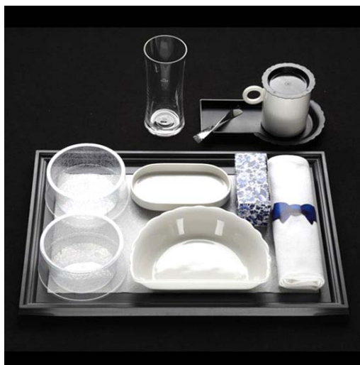
Рис. 6. Набір посуду для першого класу королівських голандських авіаліній KLM

Останньою розробкою Марселя в 2011 році стала колекція для Vassarat. Ним був створений «Канделябр Царя», названий на честь Миколи II, висотою 3,25 м., 79 ламп; а створений пізніше «Канделябр Цариці» на 24 лампи, 2,15 м. високою. Один з двох канделябрів знаходиться в експозиції паризького музею Vassarat поряд з коштами і «Царським сервізом» доповнює історичну колекцію та трепетно зберігається компанією.