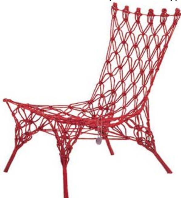
Рис. 1. Knotted Chair

Як будь-який майстер Вандерс з особливим трепетом ставиться до деяких своїх робіт. Серед них, звичайно, Knotted Chair, що приніс дизайнерові світову популярність, готель «Lute Suites» в Амстердамі, «дорогоцінні» колекції сантехніки «Aqua Jewels» і табурети «Stone» (рис. 1).