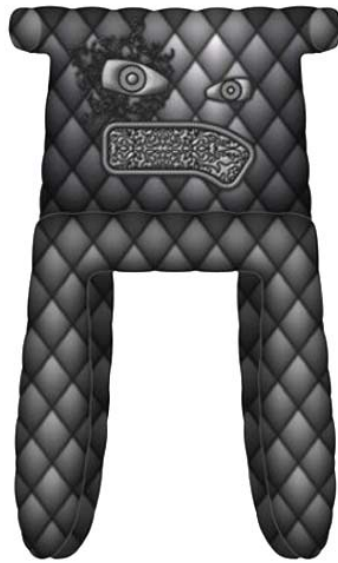
Рис. 4. Monster Chair

Нещодавно, компанія MAC і один з найбільш харизматичних дизайнерів нової хвилі Марсель Вандерс створили нову колекцію косметики класу люкс. Колекція вийшла дуже епатжна і стильна. Ця колекція кардинально відрізняється від усього, що до цього створювалося компанією MAC (рис. 5).