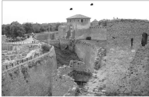
Рис.1. Результат виявлення областей кло-ну й прообразу на ЦЗ методом, запропонованим в [8] (виявлені області виділені й пофарбовані в червоний колір)

а коректування розміру блоку, що використовується при аналізі, з урахуванням розмірів областей кло-ну/прообразу принципово дозволяє аналізувати їх при будь-яких розмірах.