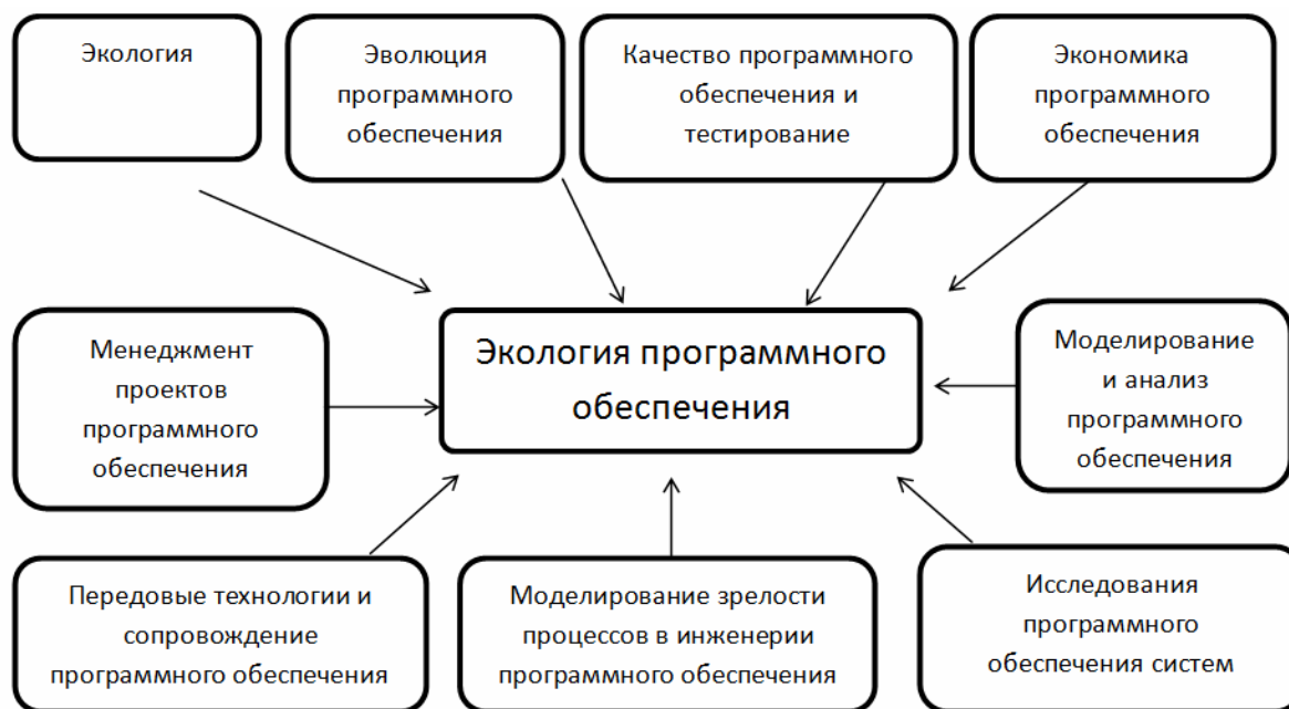
Рис. 1 Междисциплинарные связи дисциплины «Экология программного обеспечения»

Большинство из дисциплин, знания которых требуется для изучения дисциплины «Экология программного обеспечения» студент получает в бакалаврате «Программная инженерия» [5].