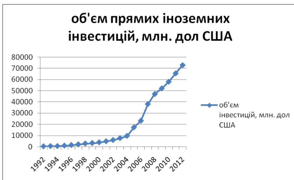
Рис. 1 Динаміка росту об'єму інвестицій

Безумовно найкращим показником інвестиційної привабливості країни є прямі іноземні інвестиції, що свідчить про високу перспективність ринку. З кожним роком в Україну приходить все більше прямих іноземних інвестицій. На графіку зображено динаміку росту об'єму інвестицій (рис. 1)[3].