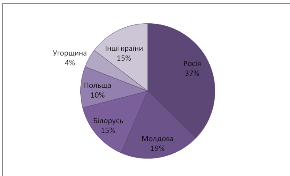
Рис.4. Рейтинг 5 головних країн в'їзного туризму у 2010 році [розроблено автором за даними [3] ]

Найбільша кількість туристів відвідали нашу країну з Росії – 37 %, Молдови – 19 %, Білорусії – 15 %, Польщі – 10 % та Угорщини – 4 % [рис 4].