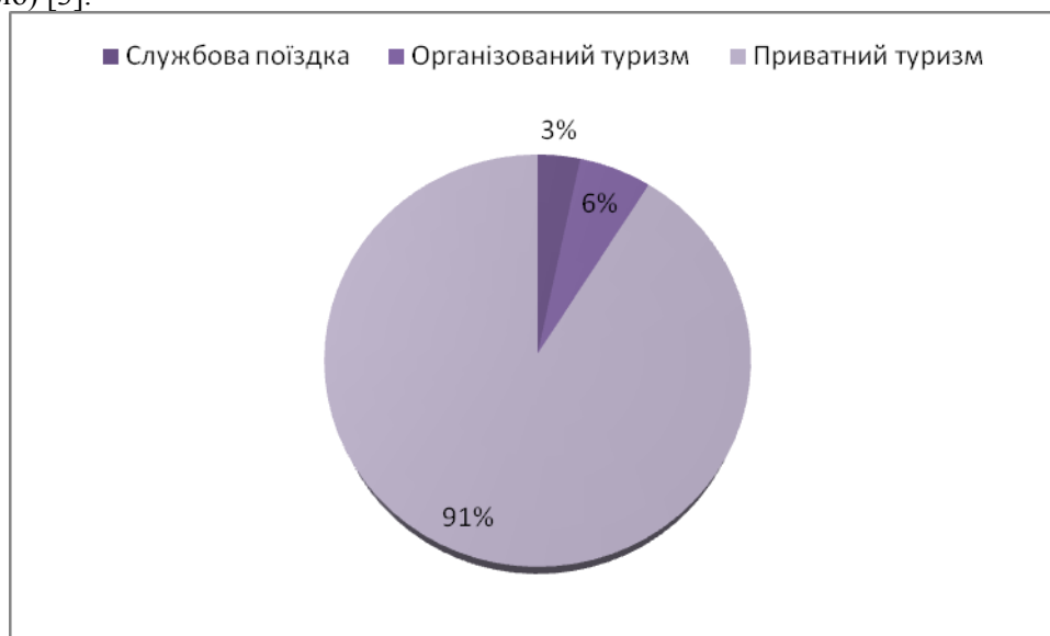
Рис. 2. Структура в'їзного турпотоку за мотивацією у 2010 році (млн.осіб) [розроблено автором за даними [3] ].

У структурі в'їзного турпотоку [рис. 2] відбулися такі зміни – частка організованого туризму зменшилась з 7 % за 2009 р. до 6 % за 2010 р. частка приватного туризму збільшилась з 89 % за 2009 р. до 91 % за 2010 р., частка службових поїздок, як і у 2009 р залишилась 3 %. Поїздки з приватною метою зросли на 4 %. Найбільше збільшення спостерігається по туристах з країн: Росія (на 20 % або на 1,2 млн. осіб), Словаччина (на 14 % або на 70,1 тис. осіб), Угорщина (на 16 % або на 124,5 тис. осіб), Білорусь (на 3 % або на 95,3 тис. осіб), Німеччина (на 7 % або на 8 тис осіб). Поїздки з організованого туризму зменшилися на 17 %. Найбільше падіння турпотоку спостерігається з таких країн: Білорусь (на 23 % або на 39,6 тис. осіб), Канада (на 18 % або на 2 тис. осіб), Польща (на 11 % або на 19 тис. осіб), Росія (на 34 % або на 193,3 тис. осіб), США (на 5 % або на 2,6 тис. осіб). Поїздки з службовою метою зменшилися на 10 %. Найбільше падіння спостерігається по турпотокам з таких країн: Латвія (на 10 % або на 0,7 тис. осіб), Польща (на 2 % або на 3 тис. осіб), Росія (на 38 % або на 110,6 тис осіб) [3].