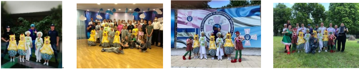
Рис. 2. Відвідування вихованцями студії дитячого будинку «Перлінка» та літнього табору для дітей військовослужбовців

Кожна дитина студії отримала подяку від головнокомандувача ВМС ЗСУ.