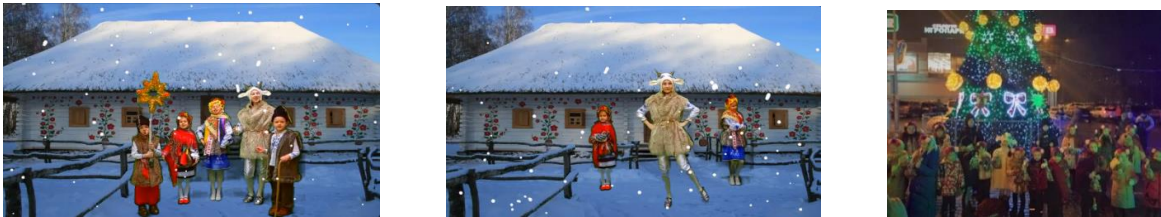
Рис. 5. Участь у календарно-обрядових дійствах

У роботі з дітьми віддається перевага практичним методам та формам, особливо, коли відбувається патріотичне виховання. Це означає, ми намагаємось знайомити дітей з літературними творами, поезію, елементами побуту українського народу. А календарно-обрядові дійства є прекрасним відтворенням циклічності природи та ознайомлення з українськими традиціями (рис. 5).