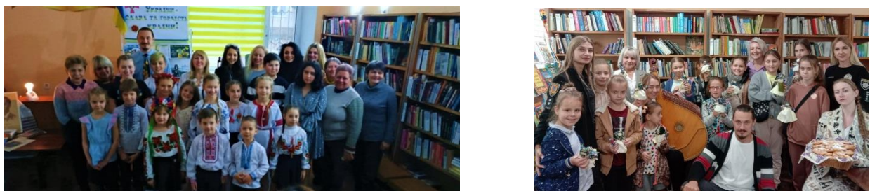
Рис. 5. Спільні заходи з філією бібліотеки № 37, м. Одеса

Студія має друзів - це ЦМБС для дітей м. Одеси, Філіал бібліотеки № 37, з якими ми тісно співпрацюємо. І вже провели разом багато бесід, тематичних зустрічей та концертів на патріотичну тематику (рис. 6).