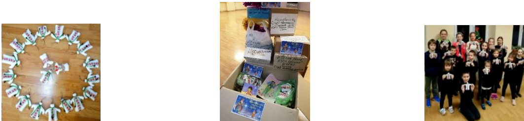
Рис. 1. Сувеніри-обереги у вигляді маленької вишиванки для українських воїнів

Однією з форм подачі патріотичного виховання стало залучення вихованців та їх батьків до волонтерської діяльності. Спочатку у формі власного прикладу художній керівник студії вів активну волонтерську діяльність в Муніципальному гуманітарному центрі Пересипського району. Також, неодноразово художній керівник брав участь у волонтерських заходах, присвячених підтримці дітей переселенців і дітей військовослужбовців; відвідував відділення дитячої онкогематології в Одеській обласній клінічній лікарні. Згодом, діти почали наслідувати гарний приклад свого вчителя та з великим захопленням і почуттям відповідальності юні актори виготовляли сувеніри-обереги у вигляді маленької вишиванки для українських воїнів (рис. 1)..