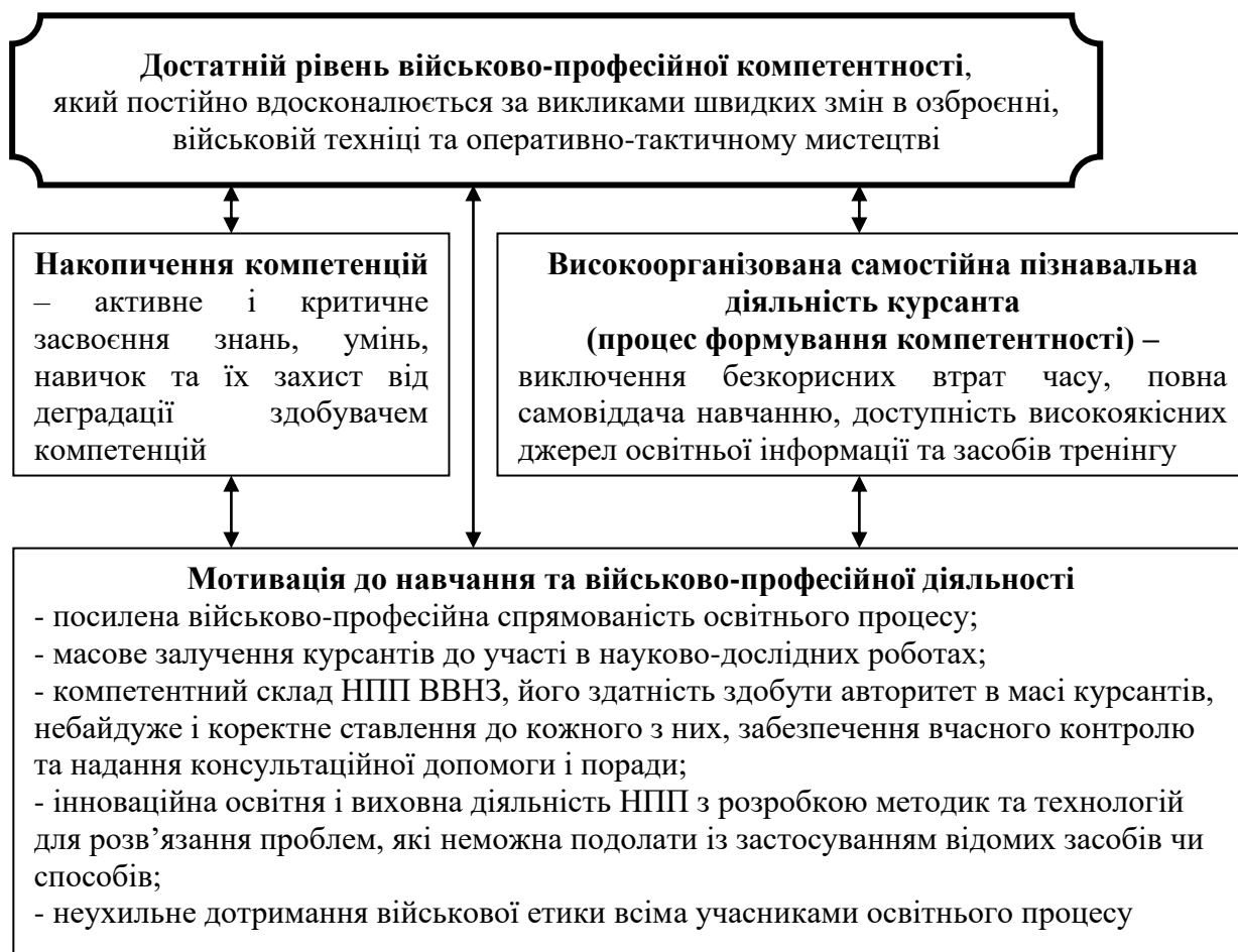
Рис. 2 Фундаментальні основи формування військово-професійної компетентності

психофізіологічне явище, яке може виникати лише у наслідок здобуття деякої критичної маси знань, умінь, навичок та практичного досвіду, а також, у наслідок практичної діяльності за фахом, придбання здатності самостійно або в складі військового підрозділу досягати поставленої мети. На рисунку 2 показані фундаментальні основи формування військово-професійної компетентності.