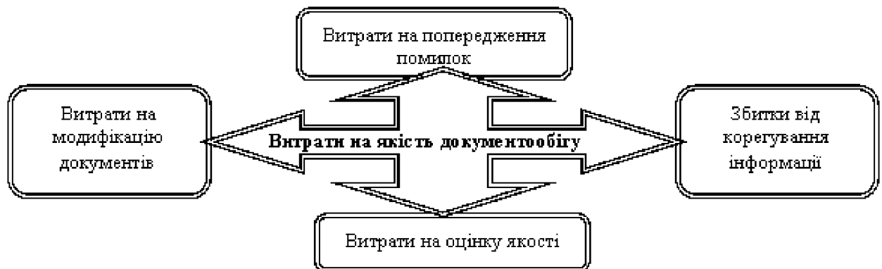
Рис. 2. Структура витрат на якість документообігу

Узагальнюючи дослідження науковців, щодо впровадження електронного документообігу, можна зазначити, що на конкурентоспроможність підприємства має вирішальний вплив якість документообігу, яка в сучасних умовах формується під впливом таких основних факторів: можливість і бажання підприємства оперативно впроваджувати останні досягнення науково-технічного прогресу; вивчення вимог ринку; інтенсивне використання «людського фактора» через навчання робітників і керівників, систематичне підвищення кваліфікації, матеріальної і моральної мотивації працюючих. Всі витрати на якість документообігу умовно можна поділити на 4 групи (рис. 2).