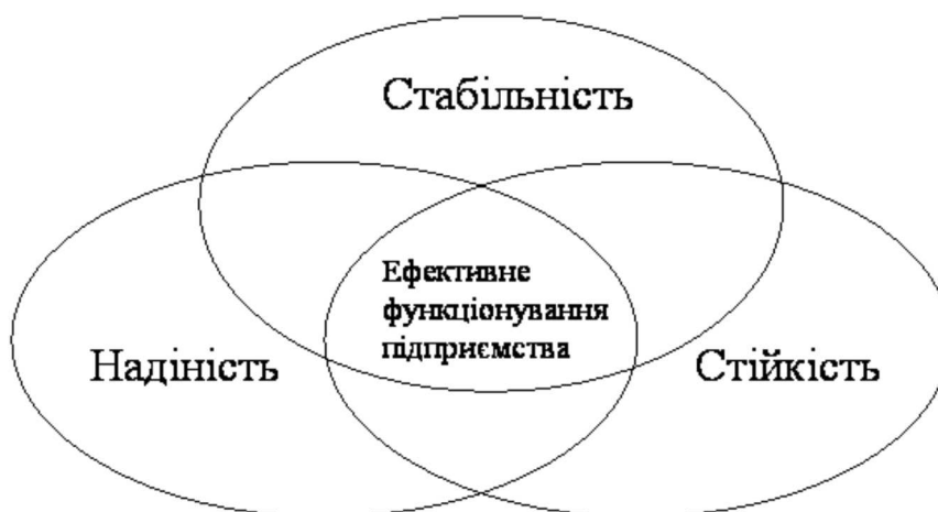
Рис. 1. Взаємозалежність категорій «надійність», «стійкість», «стабільність».

Якщо стійкість управління – це властивість системи зберігати свій первісний стан спокою чи руху в умовах зовнішніх впливів, то стійкість підприємства – це здатність системи зберігати свій працездатний стан з досягнення запланованих результатів при наявності різних впливів [4, с. 79].