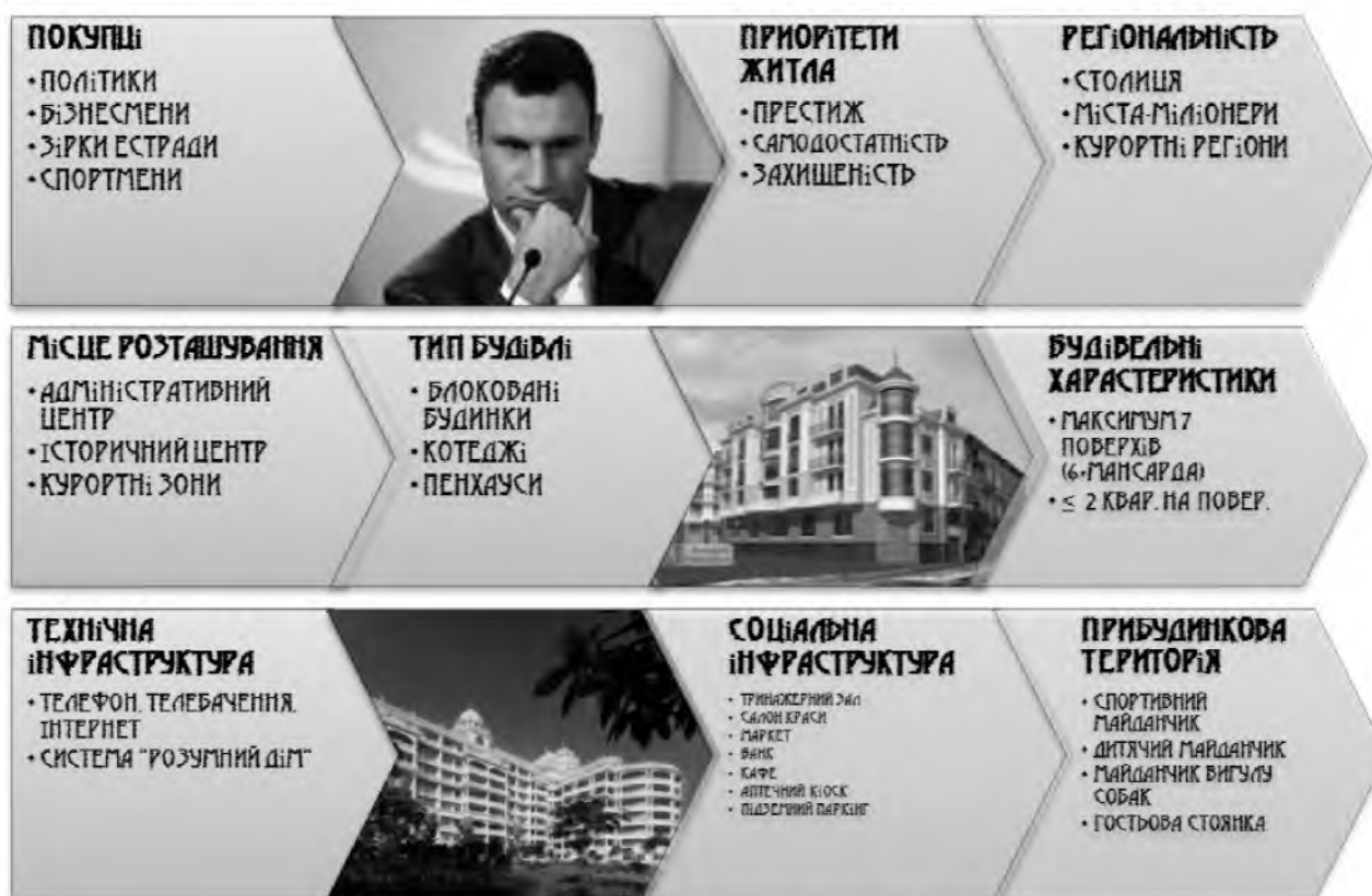
Рис 3. Особливості житла «De lux»

Елітні квартири орієнтовані на дуже багатих людей. Цим пояснюється невелика частка дорого житла в загальних обсягах будівництва 10-12%. Нерухомість категорії «De lux» характеризується наступними особливостями (рис 3), вони найбільше імпонують психотипу «егоїст».