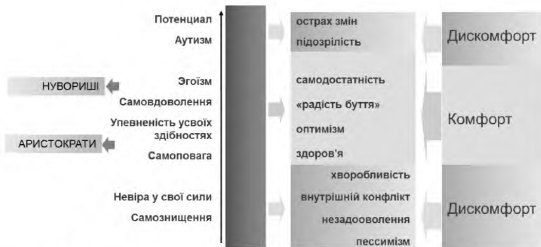
Рис 1. Уточнення зон психологічного комфорту для покупців елітного житла. Психотип «Егоїст»

Зауважимо, що для інших психотипів умови комфорту будуть суттєво відрізнятися. Для порівняння, на рис. 2 представлені умови для «споглядачів».