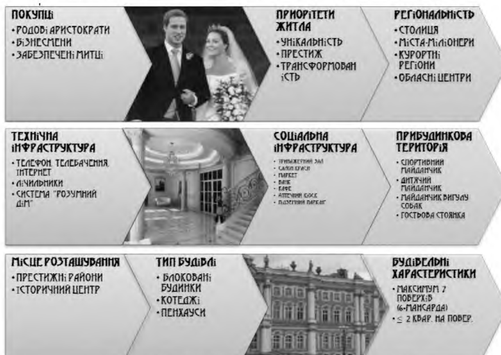
Рис. 4. Особливості житла «Premium»

Категорія «Premium» відзначається наступними особливостями (рис.3), вони найбільше імпонують психотипам «споглядач» та «борець».