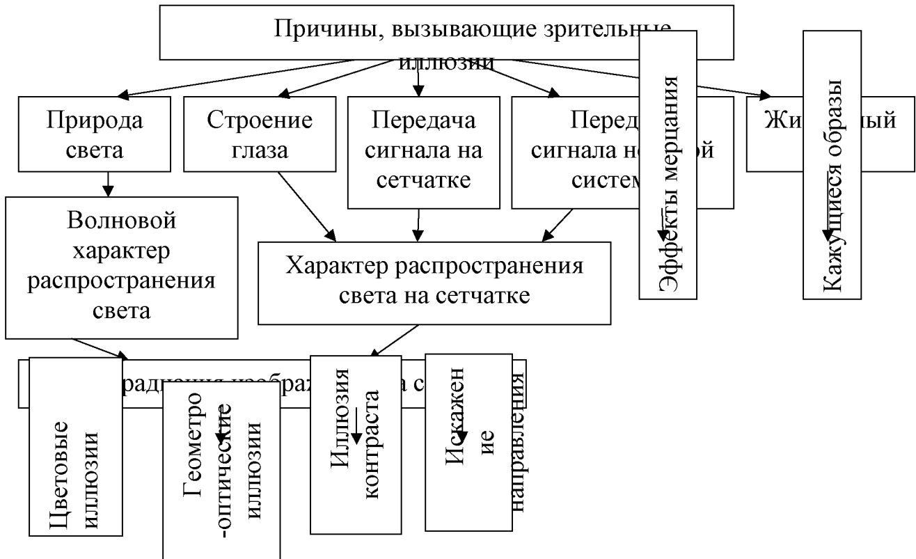
Рис. 3. Схема распределения зрительных иллюзий

Из представленной схемы видно, что большинство иллюзий возникают из-за двух основных факторов: волновой природы света и способа формирования