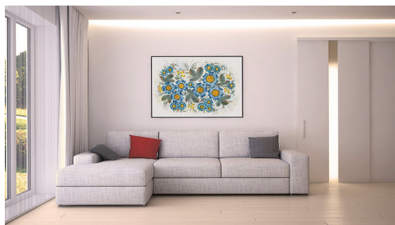
Рис. 10. Оздоблення інтер'єру вишитою картиню