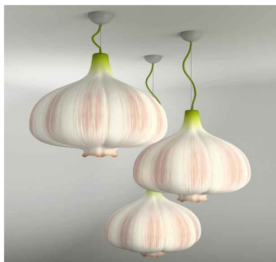
Рис.4. Світильник «Garlic» дизайнер А.Населевец