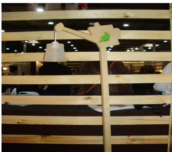
Рис.3. Торшер. Виставка "Design living tendency" 2014р