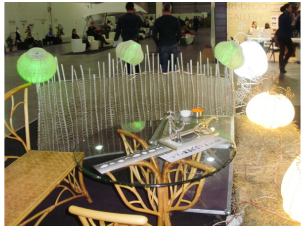
Рис. 5. Оформлення перегородок