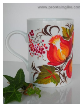
Рис. 11. Оздоблення посуду петриківським розписом

Висновки. Визначено можливість та важливість використання національного стилю в дизайні інтер'єрів офісних приміщень, зокрема, місця та форми використання національного орнаменту. Оздоблення не має бути багато, щоб не відволікати працівників, так як офіс все ж таки місце де працюють. Тому кабінетний стиль можна підтримати, використовуючи м'які, неагресивні тони, що гармоніюватимуть із загальним дизайном приміщення.