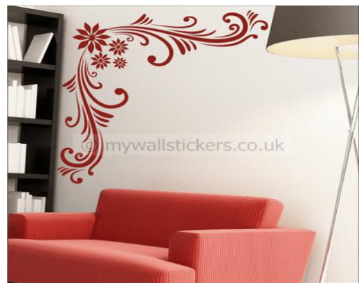
Рис. 7. Оздоблення стін орнаментом та візерунками