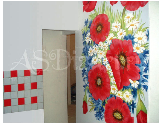
Рис. 8. Використання петриківського розпису на стелях та перегородках

Стіни можна оформити художнім розписом (рис. 7). Дуже вишукано на поверхнях виглядають барвисті зображення національних орнаментів візерунків, птахів та квітів.