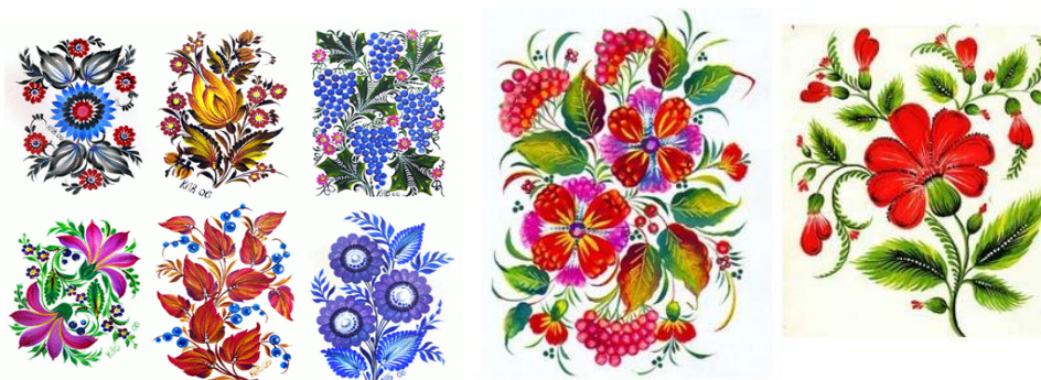
Рис. 9. Варіанти зображення петриківського розпису

перегородках, стінах, та стелі. Але бажано, щоб орнамент та розпис були акцентом в інтер'єрі, і підкреслювали національний стиль.