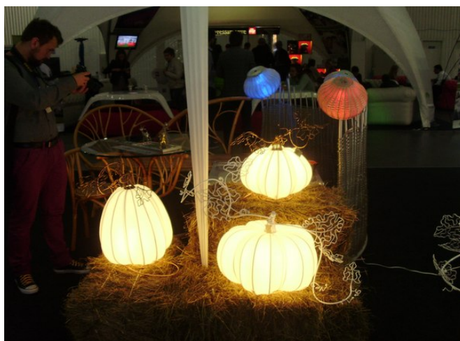
Рис.2. Світильники з художнім образом гарбузів. Виставка "Design living tendency" 2014р.