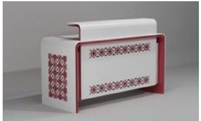
Рис. 6. Застосування орнаменту на офісних меблях