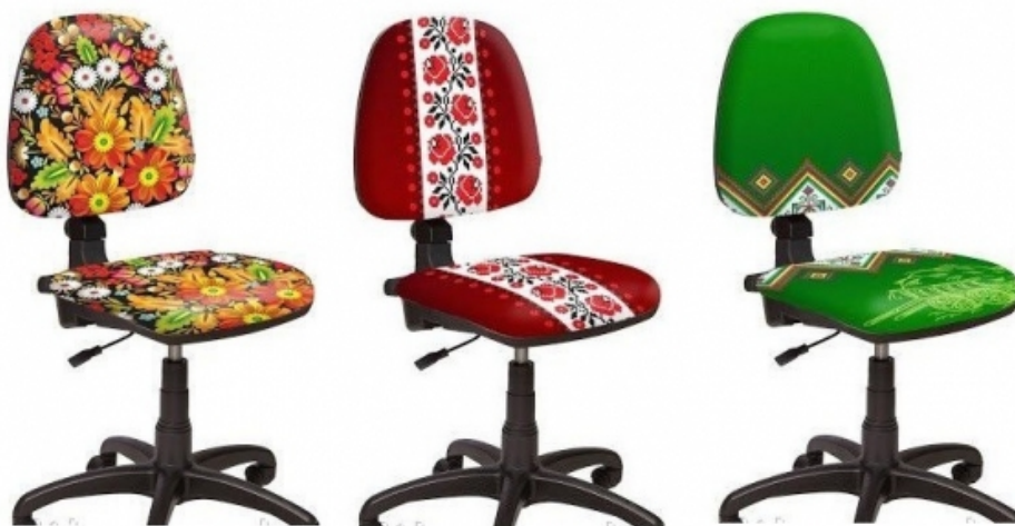
Рис.1. Оздоблення стільців українським орнаментом

Для офісу, виконаного в українському стилі, доречно застосовувати елементи національного орнаменту. Досить гармонійно може виглядати орнамент на перегородках, стінах, меблях (рис. 1, 6). та навіть на освітлювальних приладах. В якості освітлювальних приладів можна використовувати різні свічники, старовинні лампади або плафони у формі квітів, наприклад, волошок або соняшників.