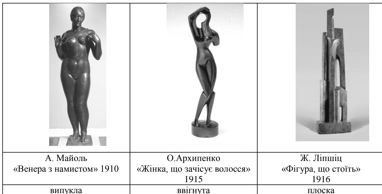
Рис. 1. Типи формоутворюючих поверхонь скульптури

відчуття внутрішньої енергії, що спрямована назовні (рис.2а). Вона рівномірно наповнює виступаючі (з погляду геометрії – з додатною кривиною) поверхні пластичного об'єму. Відповідно простір під дією цих сил ніби відступає, підкорюється скульптурі. Скульптура діє як самостійний оптичний образ, вона заповнює собою простір, але при цьому залишається в певній мірі ізольованою від навколишнього середовища.