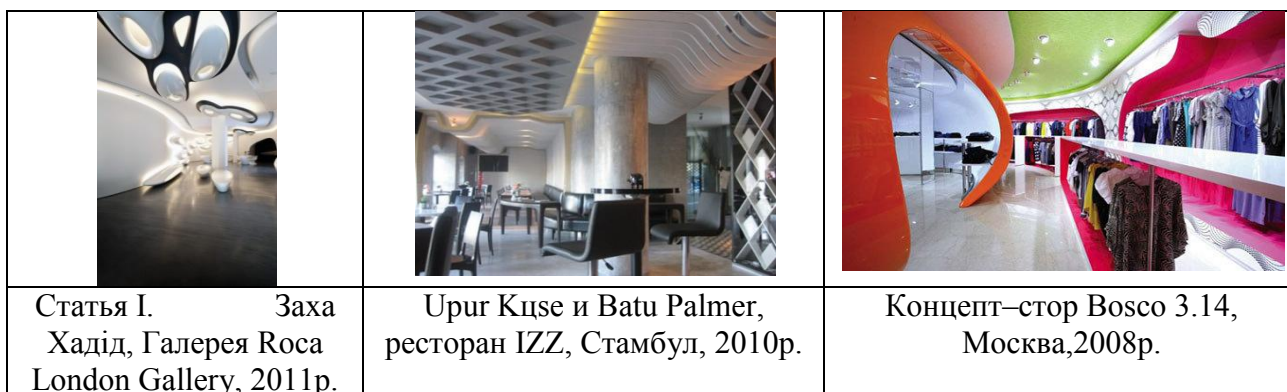
Рис. 2 – Приклади футуристичних інтер'єрів

Це виражається через чіткість ліній, обмежену кількість кольорів. Центральне місце займають всі відтінки білого, присутні лише яскраві акцентні плями, що зображується на рис.2.