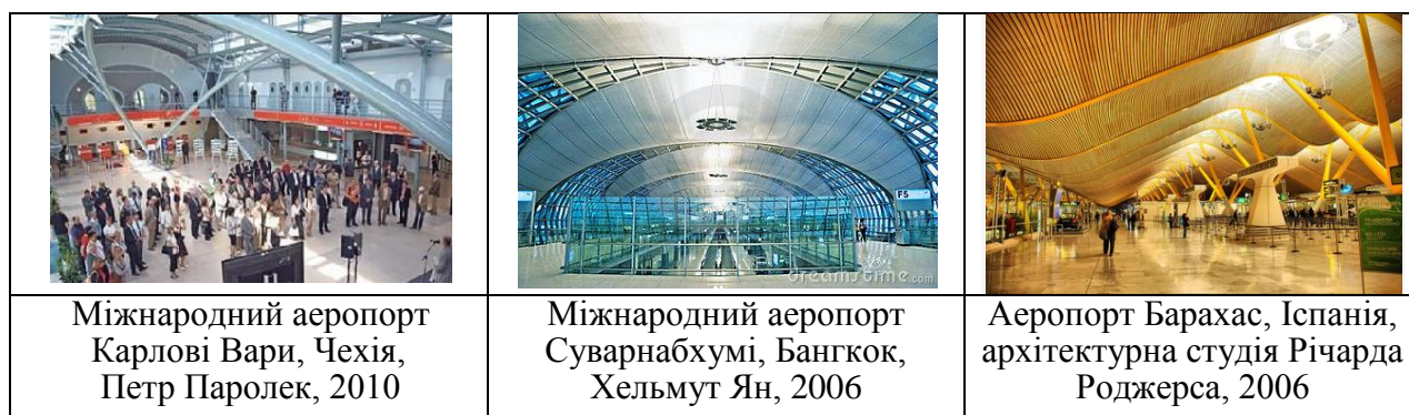
Рис. 1 – Конструкції стель та опор аеровокзалів.

Даний стиль стверджує, що технологія більш красива, ніж твори мистецтва. Це твердження відображується в оформленні інтер'єрів аеропортів, особливо в конструкціях стель, та опор, котрі їх підтримують (рис.1).