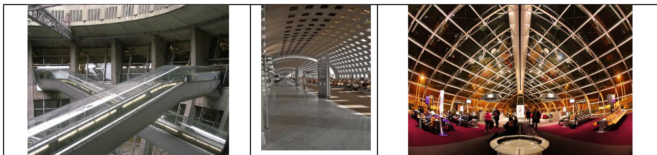
Рис. 3 – Міжнародний аеропорт Руассі–Шарль–де–Голль, Париж, Поль Андре, 1974р.

Французький архітектор Поль Андре розробив проект терміналу I паризького аеропорту Шарль де Голль (1974 р.) в Руассі, в якому прослідуються риси естетичних категорій гармонія та міра (рис.3).