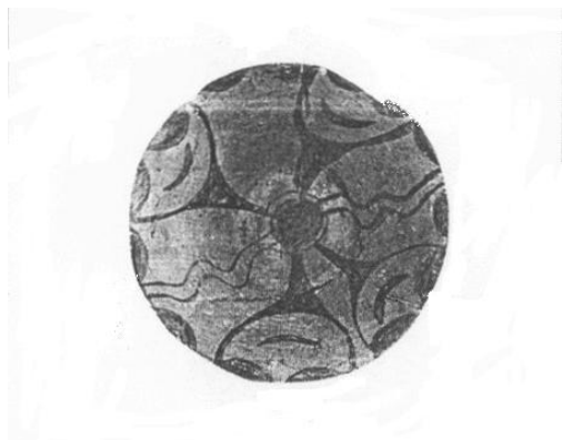
Рис. 3. Трипільська миска

структури є рис.3 і 4. На трипільській мисці (рис. 3) зображено сімку богів і ромб – символ Богині. Очевидно чотири однакових образи є богами (роти у вигляді місяця), а три інші однотипні образи і ромб – богинями. Зображення богів і богинь чергуються. Цю ж структуру відтворено на подільському рушнику (рис. 4) Тут умовними деревами–драбинками (вузькі сфери) передано богів, а в ширших сферах зображено чотири богині.