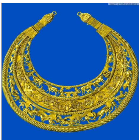
Рис. 6. Скіфська пектораль.

і відома скіфська пектораль з Товстої Могили (Дніпропетровська область), відкрита в 1971 р. Б.Мозолевським. (рис. 6).