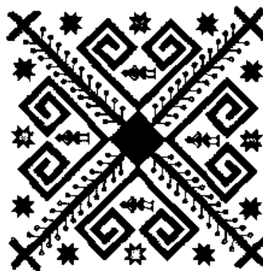
Рис. 4. Подільський рушник.

Якщо семичленими структурами моделювали вертикальну будову Космосу, то восьмичленими передавали фази циклів планет. Цикли планет (в першу чергу Венери, Сонця і Юпітера – Богинь) ділились на восьмичленні структури. Звідси походить порядок свят богів і богинь в річному (сонячному) циклі. Свята богинь припадають на рівнодення і сонцестояння, а богів на періоди між ними. 1 sph (взимку перед весною) – Кострома чи Коструба (Меркурій), 2 sph (рівнодення) – Масниця (Венера), 3 sph (весна) – Ярило (Місяць), 4 sph (літнє сонцестояння) – Купала (Сонце), 5 sph – (після Купали) свято бога Громолика (Марс), 6 sph (осіннє рівнодення) – Самхейн (у кельтів), Юпітер, 7 sph (кінець осені, початок зими) – Сатурн (сатурналії в Римі). Очевидно свято Великої Богині припадало на зимове сонцестояння.