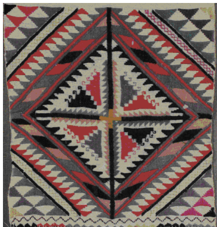
Рис. 7. Подільський рушник.

Поєднання сфер і чисел (їх доповнення) допомагає проникнути в суть символіки на археологічних артефактах та в народні орнаменти. В них закодовано праміф – світогляд давніх людей. Прикладом такого поєднання є орнамент цього подільського рушника (рис. 7).