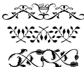
Рис. 5. Ю. Гордон. Орнаментальные сетки для проекта «Цветы зла», Россия, 2007.

Яркий пример тому – серия гарнитур известного российского дизайнера Ю.Гордона под общим названием «Цветы зла». Эти шрифты, помимо алфавитных знаков, включают растительные орнаментальные элементы в духе декаданса. В композиции они создают несколько гнетущую атмосферу, передавая настроение стиля (рис. 5).