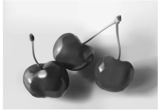
Рис.2 Фрагменти курсових робіт за тематикою «Робота у векторному середовищі. Види композиції»

Тематика дипломних робіт досить різноманітна, відповідає уподобанням випускників та дає їм змогу реалізувати в повній мірі весь комплекс знань, умінь та навичок, що були здобуті протягом навчання.