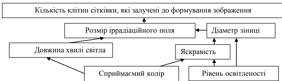
Рис. 1. Схема, яка відображає чинники, які впливають на кількість клітин, залучених до формування зображення

Таким чином, розміри іррадіаційного поля (тобто зон збудження сітківки) залежать від фізичних параметрів світлової хвилі та від рівня освітленості об'єкта. А розмір зон збудження, в свою чергу, впливає на кількість клітин сітківки, залучених до процесу сприйняття (схема рис. 1).