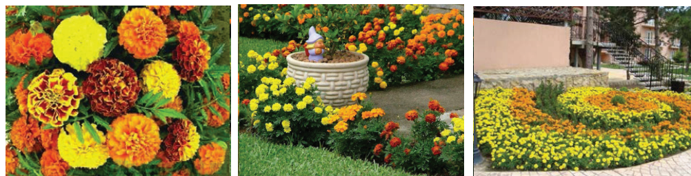
Рис. 2. Використання чорнобривців в контрастних орнаментах

злив сил. Яскраві червоні квіти створюють акценти у квіткових композиціях, їх використовують для геометричних орнаментів (рис. 3 А).