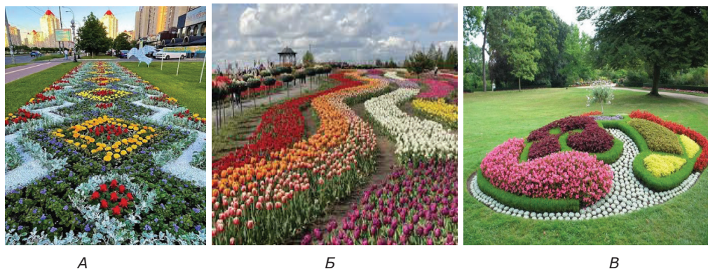
Рис. 1. Орнаментальні геометричні квітники: А – ромбовидний; Б – хвилястий; В – круглий