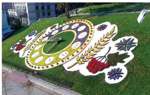
Рис. 9. Розкриття квіткових композицій у парку Кекенгоф, Нідерланди [19]