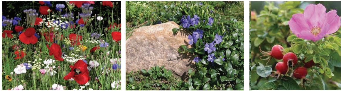
А Б В