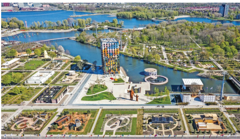
Рис. 7. Гігантська мозаїка Floriade Expo 2022 у Флоріаде, Нідерланди [18]

«Квітковий годинник» у Києві [5] – це приклад сучасного міського квітового орнаменту,