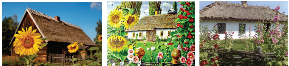
А Б В