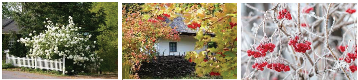
А Б В