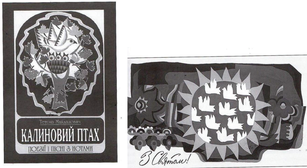
Рис. 2. Обкладинка книги «Калиновий птах», 2004 Вітальна листівка «З святом», голландська гуаш, 1979

Книга пісень та поезій із ліричною назвою «Калиновий птах» зачаровує своїм лаконічним і вишуканим дизайном (рис. 2). Тут використаний декоративний твір Леоніда Андрієвського. Композиція побудована на овалах, бо центром композиції є птах з розкритими крилами. Нижче – гніздечко з пташенятами. Основна форма, яка зашифрована в орнаменті – це яйце, як символ Всесвіту і нового життя. Під ілюстрацією, в прямокутнику