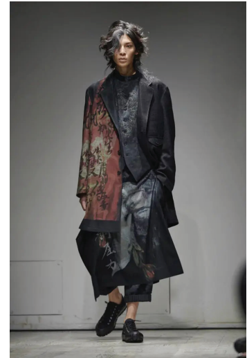
Рис. 6. Колекція осінь-зима 2022–2023р., Й. Ямамото