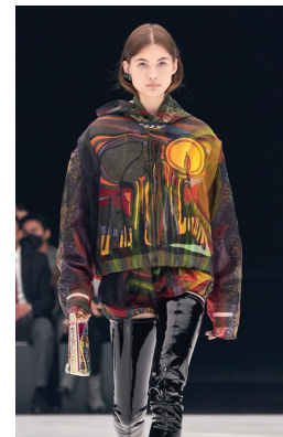
Рис. 9. Колекція сезону весна-літо 2022 р., Жіванші

У сучасному дизайні одягу модернізація одягу стала однією з ключових концепцій. Це зрозуміло, оскільки мода не лише втілює красу, але й взаємодіє з художніми техніками і мотивами, щоб створити унікальний синтез мистецтва і моди. Використання художніх технік та елементів у дизайні одягу дозволяє створити речі, які втілюють концепції сучасної моди та естетики. Домінування індивідуального смаку і самопрезентація через дизайнерські речі набули актуальності в середовищі творчої молоді, попит і пропозиції кастомних послуг набирає обертів в інтернет-мережах. Це пов'язано з використанням різних кастомних технік та їх взаємодію для створення унікального дизайну.