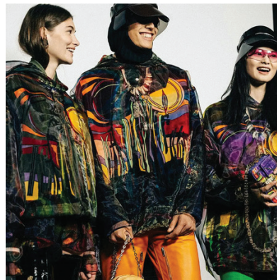
Рис. 8. Колекція сезону весна-літо 2022 р., Жіванші