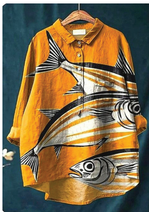
Рис. 2. Художній розпис з використанням акрилових фарб