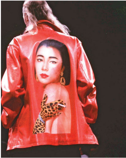
Рис. 4. Колекція осінь-зима 1991 р., Й. Ямамото