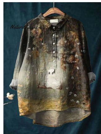
Рис. 3. Розпис аерографом та акриловими фарбами