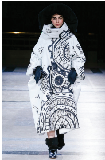
Рис. 5. Колекція весна-літо 2002 р., Й. Ямамото