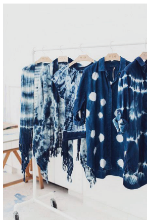
Рис. 1. Художній розпис в техніці вузликового батіку

Існує кілька основних видів батіку – гарячий, холодний та вільний розпис. Вони відрізняються способом резервування тканини. При холодному батіку резервуючий склад наносять на тканину у вигляді замкнутого контуру, в межах якого спеціальними фарбами відповідно до ескізу розписують виріб. Художні особливості цього способу розпису полягають у тому, що наявність обов'язкового кольору контуру та використання цього контуру для різноманітних орнаментальних розробок надає малюнку графічно чіткого характеру. При цьому кількість кольорів, які застосовуються для розпису, практично необмежена. Класичний гарячий батик – дуже трудомісткий вид розпису, декілька днів