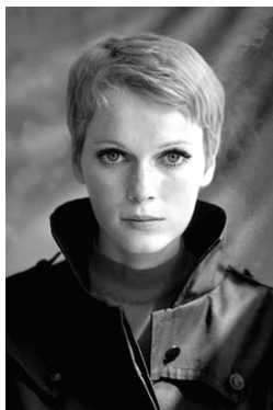
ж) Зачіска «піксі». Актриса Міа Ферроу для фільма «Дитина Розмарі». 1968 [10]