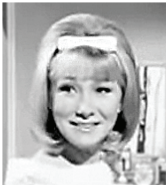
з) Образ актриси Джойс Блер для фільму «Будь моїм гостем», 1965 [10]