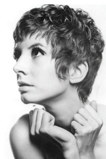
е) Зачіска в стилі грецької богині, або зачіска Goddess. Актриса Джейн Джонс, 1967 [11]