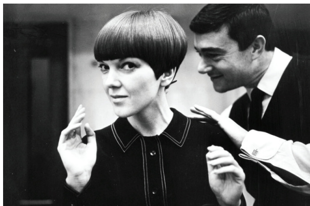
Рис. 1. В. Сассун під час виконання зачіски Мері Квант. Велика Британія, 1964 [12]

Про геометрію, як основу формотворення стрижок В. Сассуна, пише Б. Вебер: «Для пана Сассуна стрижка була головною – практично