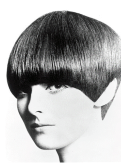
в) Стрижка «боб». Модель Грейс Коддінгтон, 1965 [16]