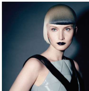
Рис. 6. Стрижка з колекції «Нова сила». Творча група Sassoon під керівництвом Марка Хейса [14]