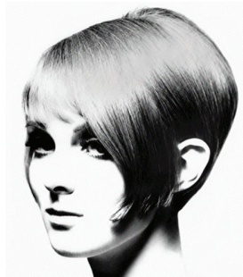
д) Градуйований «боб». Модель Грейс Коддінгтон, 1963. [11]