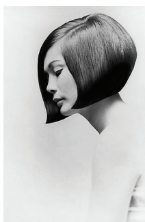
а) Стрижка «боб». Модель Ненсі Кван. Vogue, 1968 [16]