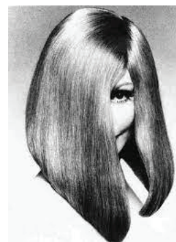
к) Варіація на тему «боб А-силуета». 1967 [12]