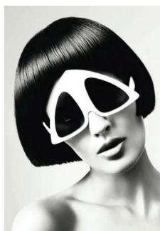
б) Стрижка «боб»; окуляри О. Голдсмита для В. Сассуна, 1972. [16]