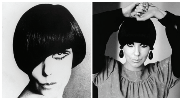
Рис. 3. Асиметричний «боб». Супермодель Пеггі Моффітт, 1960-ті рр. [10]